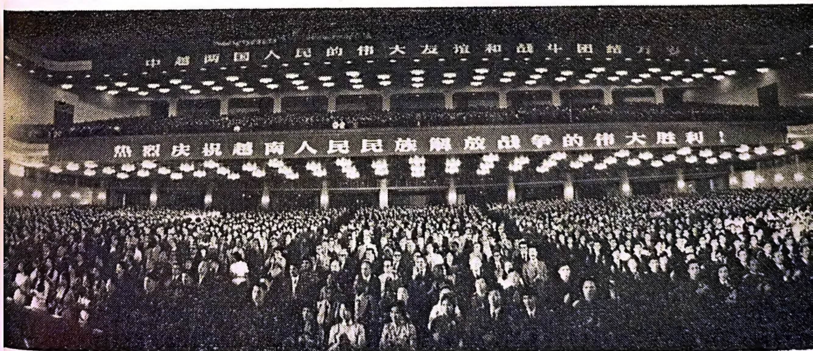
Quang cảnh cuộc mít tinh.

Nhân dân Bắc Kinh mít tinh trọng thể, nhiệt liệt chào mừng thắng lợi vĩ đại của nhân dân MNVN anh hùng giải phóng Sài Gòn và hoàn toàn giải phóng MNVN. Ảnh: Đài chủ tịch cuộc mít tinh.