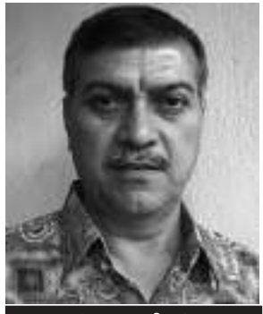
● इस्माली ●