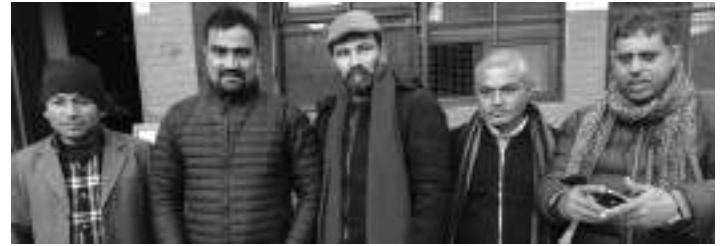
काठमाडौं । सरकारले हालै विरुद्धमा पाँच पत्रकार संगठनले ल्याएको सूचना प्रविधि विधेयकको संयुक्त विज्ञापित बाँकी ८ पेजमा

सूचना प्रविधि विधेयकको विरुद्धमा पाँच पत्रकार संगठन आन्दोलित