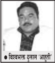
विश्वभक्त दलाल 'आहुती'

(आहुती वैज्ञानिक समाजवादी कम्युनिष्ट पार्टी नेपाल निर्माणका निमित्त अभियान समितिका संयोजक हुन्।)