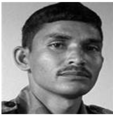
● उदयबहादुर चलाउने ●

'यता देशव्यापी कथित जङ्गल सर्च अभियानअन्तर्गत व्यापक अप्रेसन र हत्याको शृङ्खला थालियो। त्यस अप्रेसनको प्रतिरोध, हत्याको बदला र योजनाको प्रारम्भका रूपमा २०५६ असोज ५ गते फौजी, गैरफौजी कार्यक्रम सम्पन्न गरियो। यसमा उल्लेख्य घटनाका