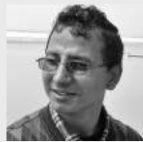
● हिरामणि दुःखी ●

बसेको छ गजधम्म सिंहदरबार देशको मुटुमा विफरग्रस्त अनुहार लिएर दृष्टि फालिरहेछ उन्मत्त साँढेको र, नियालिरहेछ हरदिन हरमौसम यस भूगोलका बबुराहरूको दैनन्दिनी, रोजाना यसको बोलीमा जङ्गोको कासन भइरहेछ प्रतिध्वनित र, चन्द्रले छर्केको अत्तर डुङ्गुङ्गुती गन्हाइरहेछ यसको छालामा ठान्छ आफूलाई सिंहदरबार सम्वाहक परिवर्तनको मात्र दौडाएर सनातनी एक्का ।