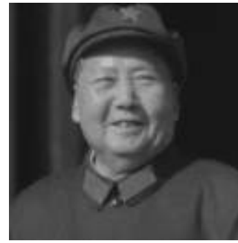
● माओत्सेतुड ●

तर अर्को प्रकारको मानिसहरूसँग व्यवहार गर्ने भने गाह्रो छ । ट्राट्स्की जस्ता र चीनका छन तु-यू, चाङ क्व-ताओ र काओ काङ जस्ता मानिसहरूप्रति सहयोगपूर्ण प्रवृत्ति अँगाल्न असम्भव थियो किनभने उनीहरू सच्याउने नसकिने खालका थिए । अनि हिलर, च्याङ काई-सेक र जारजस्ता मानिसहरू थिए र उनीहरू पनि सच्याउने नसकिने खालका थिए र उनीहरूको त्ख्या पट्टाईदिने पऱ्यो किनभने हामी र उनीहरू बीचको सम्बन्ध एकदमै परस्पर निषेधकारी थियो । यस अर्थमा उनीहरूको स्वभावको एउटा मात्र पक्ष छ, दुईवटा होइन । अन्तिम विश्लेषणमा, साम्राज्यवादी र पुँजीवादी प्रणालीहरूका हकमा पनि यही कुरा साँचो हो, जुन प्रणालीहरूलाई अन्ततः समाजवादी प्रणालीद्वारा विस्थापित गर्नु अनिवार्य छ । विचारधाराको क्षेत्रमा पनि यही कुरा