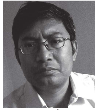
● पवनमान श्रेष्ठ ●

नेपालको सन्दर्भमा नयाँ जनवादी क्रान्ति नेपालजस्तो अर्धसामन्ती र अर्धऔपनिवेशिक देशमा विगतमा अपरिहार्य ठान्दै आएका र आज पनि आफूलाई कम्युनिष्ट भन्न नछोडिसकेका ती पार्टीहरूले नेपालको परिस्थितिमा दूरो परिवर्तन आइसकेकोले नयाँ जनवादी क्रान्तिको औचित्य समाप्त भएको कुरा गर्न थालेका छन् र अबको क्रान्ति समाजवादी क्रान्ति हुने कुरा बताउँदै आएका छन् । यसमा प्रमुख रूपमा नेमक्रिया, एमाले, माओवादी केन्द्र र नेकपा रही आएका छन् ।