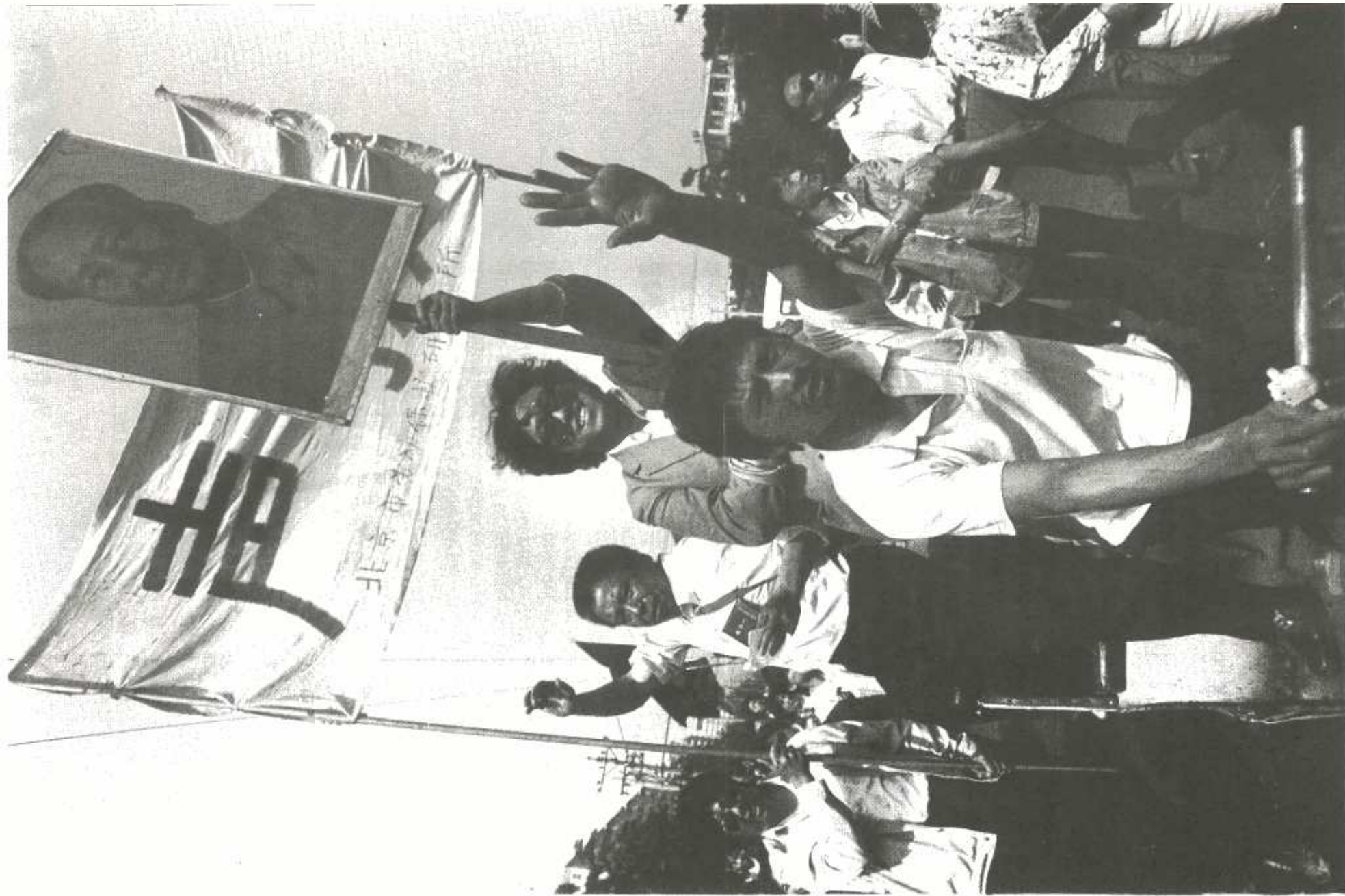
L'homme à gauche tient dans sa main les Citation du Président Mao Tséoung, le «Petit livre rouge» qui a symbolisé la Révolution Culturelle et qui a été étudié par de centaines de millions de gens en Chine et dans le monde entier.

Alors disparut la dernière forteresse socialiste du prolétariat international. Les révisionnistes et ceux qui se sont engagés dans la voie capitaliste à l'intérieur du Parti Communiste, dirigé par le rénégat Deng Xiaoping, deux fois renversé par Mao lui-même, et ses semblables tels Hua Kuo-feng, Hu Yaobang et Zhao Ziyang, usurpèrent le pouvoir d'Etat en Chine. Ils entreprirent la destruction de l'économie socialiste et les relations socialistes de productions et établirent un système de propriété privée avec le profit aux commandes.