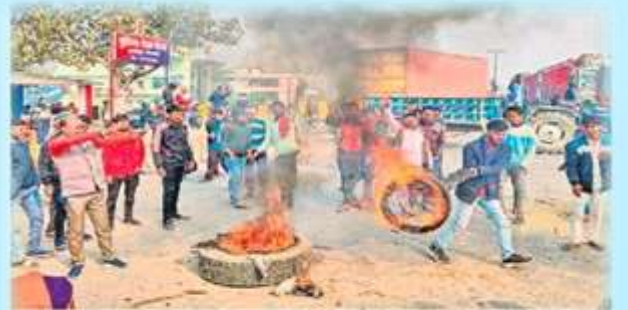
దివారలోని చాటిపూర్లో ద్రవర్ణ నిలవన