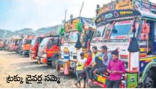
ట్రక్కు డ్రైవర్ల సమ్మె

ఇండియన్ పీనల్ కోడ్ పేరును మారుస్తూ కొత్తగా తెచ్చిన భారత న్యాయ సంహితలో హిట్-అండ్-రన్ చట్టంలో చేసిన మార్పులు, విధించిన శిక్షలకు వ్యతిరేకంగా దేశవ్యాప్తంగా రోడ్డు రవాణా కార్మికులు నిరవధికంగా సమ్మె చేశారు. రోడ్డు ప్రమాదాలకు సంబంధించి అసాధ్యమైన, అన్యాయమైన మరియు రాజ్యాంగ విరుద్ధమైన నిబంధనలతో, క్రూరమైన పెనాల్టీ మరియు శిక్షారూపైన చర్యను ఏకపక్షంగా విధించేందుకు సంబంధిత కార్యనిర్వాహక రూపాలలో పోరాటాలు చేపట్టారు.