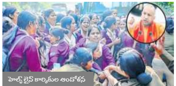
హెల్ప్ లైన్ కార్మికుల ఆందోళన

ఉత్తర ప్రదేశ్ రాష్ట్రంలో 112 హెల్ప్ లైన్ లో ఇంటిగ్రేటెడ్ ఎమర్జెన్సీ సర్వీస్ ను ప్రారంభించారు. పలు సంబర్లను గుర్తుంచుకోవాల్సిన అవసరాన్ని తొలగించడానికి ఎమర్జెన్సీ సర్వీస్ ను ప్రారంభించారు. ఎమర్జెన్సీ రెస్పాన్స్ సపోర్ట్ సిస్టమ్ (ఈ.ఆర్.ఎస్.ఎస్) కింద పోలీసు, అగ్నిమాపక దళం, అంబులెన్స్, ఇతర సేవలను పొందటం కోసం అన్నింటినీ కలుపుకొని ఉన్న అత్యవసర హెల్ప్ లైన్ నంబర్. ఈ సంఖ్య భారతదేశం అంతటా పని చేస్తుంది.