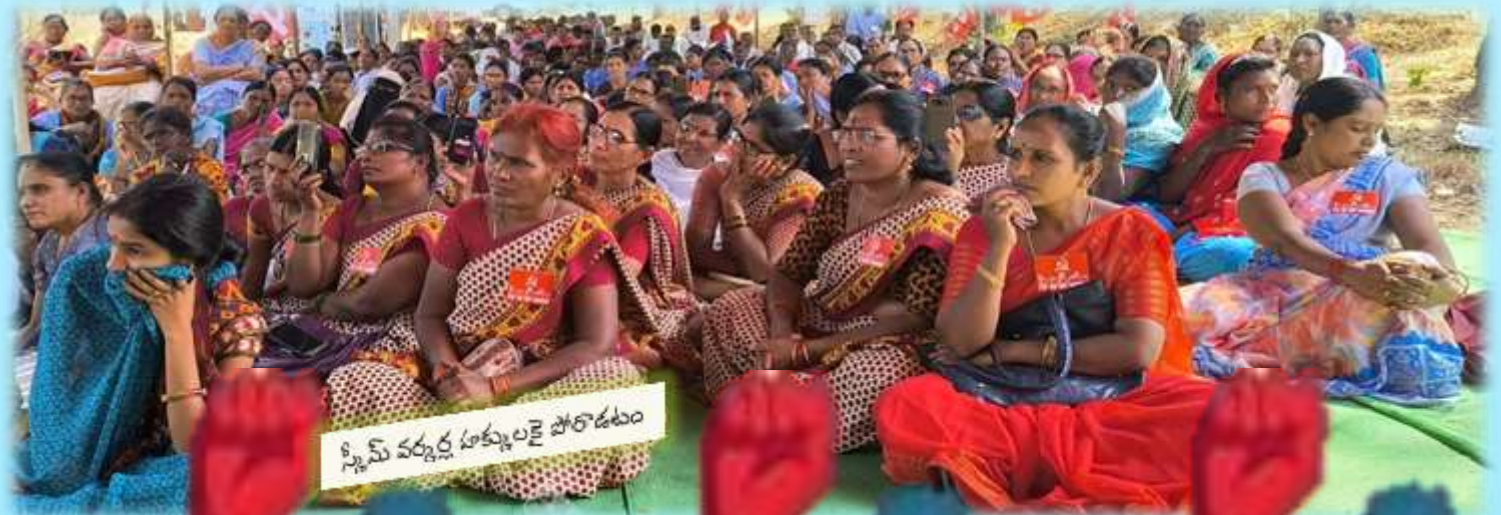
స్కీమ్ వర్కర్ల హక్కులకై పోరాడటం