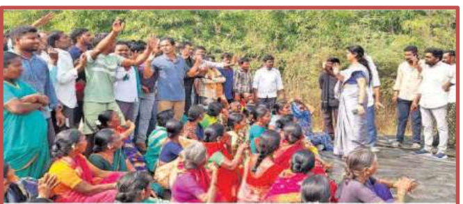
నిర్మల్ జిల్లా బలావంట్పూర్-గుండపల్లి శివారులో ఇషానాల్ పరిశ్రమను వ్యతిరేకిస్తూ రోడ్డుపై ట్రోలాయించిన రైతులు