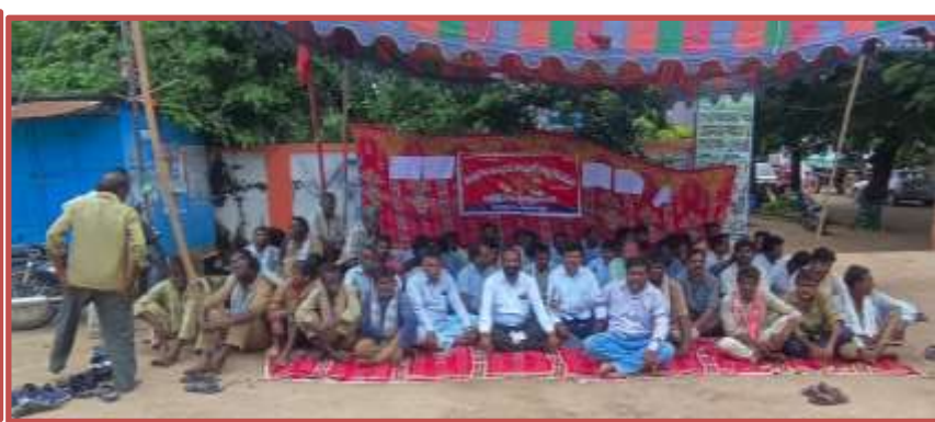
అరిజానాలో టిల్లాల్ కరికర్ డిమాండ్లను అంగీకారం పొందే ప్రయత్నం