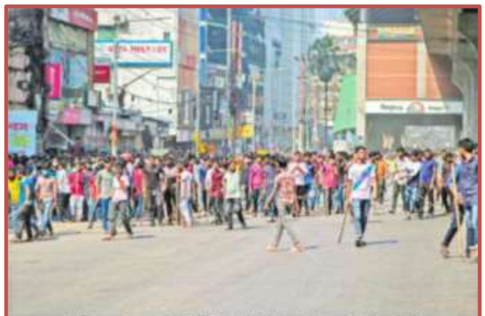
బంగ్లాదేశ్ రాజధాని ఢాకాలోని మినప్పూర్లో తమ డిమాండ్లు పెంచాలని డిమాండ్ చేస్తూ మంగళవారం ట్రాఫిక్ను ఆర్ధశుని నిరోధన వ్యక్తం చేస్తున్న గార్మింట్ కార్మికులు