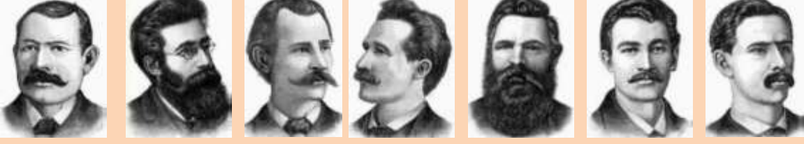
జార్జ్ ఏంజెల్ మైఖేల్ శ్వాబ్ అల్బర్ట్ పార్సన్స్ ఆగస్ట్ స్పాయిస్ సామ్యూల్ ఫీల్డెన్ ఎడోల్ఫ్ ఫిషర్ ఆస్కార్ నీబే

నలుగురు కార్మిక నాయకులు విప్లవ గీతకలు ఆలపిస్తూ ఉరికొయ్యను చేరుకున్నారు. తీవ్రంగా తమ స్థానాల్లో నిలబడ్డారు. ఉరితాళ్లు వాళ్ల మెడలో వేయబడ్డాయి. స్పాయిస్ తాడు చాలా గట్టిగా వుండింది. ఫిషర్ దానిని సరిచేస్తే స్పాయిస్ చిరునవ్వు వచ్చి ధన్యవాదాలు చెప్పాడు. తిరిగి స్పాయిస్ గొంతెత్తి “ఒక సమయం వస్తుంది, ఆనాడు మా నిశ్శబ్దం నువ్వు నేడు నొక్కివేస్తున్న స్వరాల కంటే చాలా బలిష్ఠమైనది అవుతుంది.” అన్నాడు. తర్వాత పార్సన్స్ మాట్లాడడం మొదలుపెట్టాడు. నా మాట వినండి, అమెరికా ప్రజలారా, నా మాట వినండి, జనం గొంతుకను నొక్కివేయలేరు, కానీ ఇంతలోనే ఉరికొయ్య లాగమండి”.