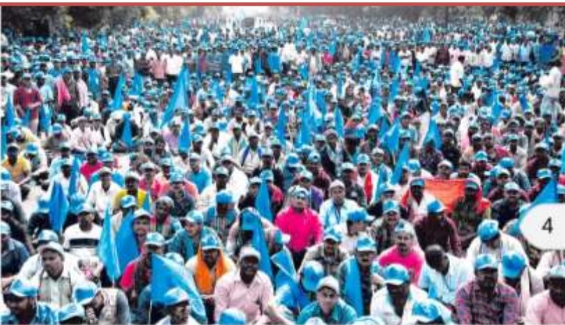
UP IN ARMS: Members of Odisha State Fishermen Federation stage a protest at Lower PMG in Bhubaneswar, Tuesday, seeking fulfillment of their 6-point charter of demands.