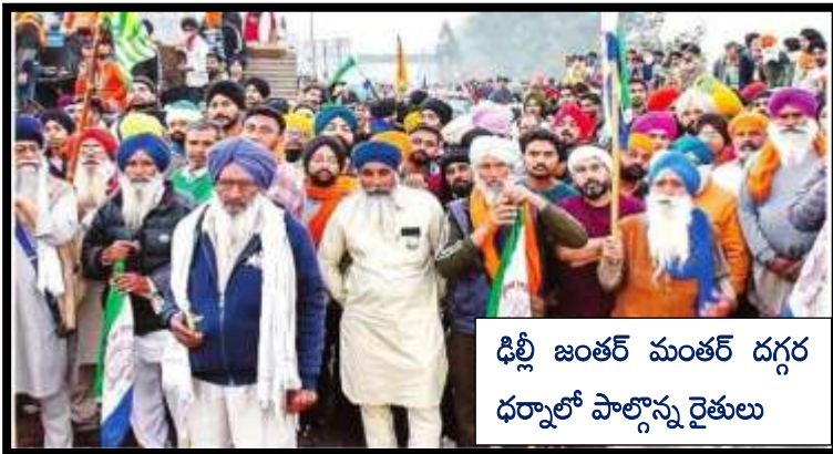
డిల్లీ జంతర్ మంతర్ దగ్గర ధర్మాలో పాల్గొన్న రైతులు

ప్రభుత్వరంగ సంస్థల ప్రైవేటీకరణ ఆపాలి. కాంట్రాక్టు, ఔట్ సోర్సింగ్ విధానాన్ని రద్దు చేసి వారిని పర్మినెంట్ చేయాలి. సంవత్సరానికి 200 రోజుల పని దినాలతో ఉపాధి కల్పించాలి. రోజుకు రూ.1000 కూలిన నిర్ణయించాలి. అంగన్వాడీ, మధ్యాహ్నభోజనం స్కీం వర్కర్లను ప్రభుత్వ ఉద్యోగులుగా నియమించాలి. వారికి కనీస