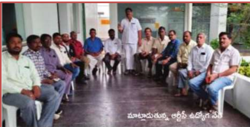
మాట్లాడుతున్న ఆర్గనైస్ ఉద్యోగ నేత