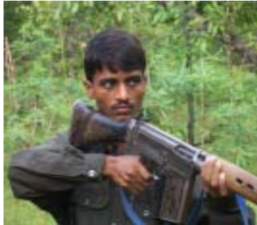
కామ్రేడ్ సాగర్ (ఎన్.టి.) అమరత్వం: జనవరి 28, 2009