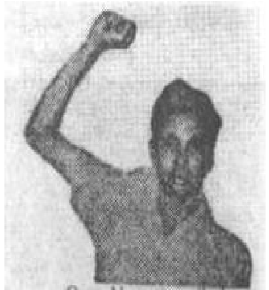
కా మెంకటాపు సత్యం