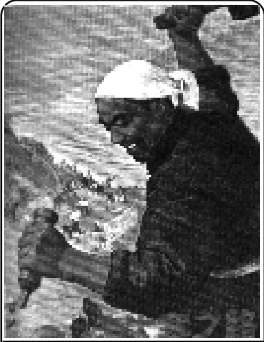
తాచాయ్ లో వరద నివారణ కోసం నదీప్రవాహాన్ని మరల్చుతున్న రైతాంగం, కార్మికులు

సోషలిస్ట్ నిర్మాణ సూత్రాలను రూపొందించడంలో కార్మికవర్గానికి బూర్జువా వర్గానికి మధ్య వైరుధ్యమే ఈ దశ పాడవునా ప్రధాన వైరుధ్యంగా వుంటుందని మావో చెప్పాడు; "వర్గ పోరాటమే