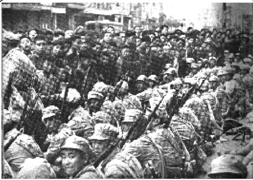
1949 లో నాన్సింగ్ ను ఆక్రమించిన తర్వాత ప్రజావిముక్తి సైన్యాలతో ముచ్చటిస్తున్న ప్రజలు

కొమింటాంగ్ విప్లవానికి విద్రోహం చేయటంతో, పట్టణ సార్వత్రిక తిరుగుబాటు ఎత్తుగడలు అనేకసార్లు పరాజయాలు పొందడంతో మావో వెనుకబడిన దేశాల్లోని విప్లవ క్రమంలో నూతన సూక్ష్మ అవగాహనలను రూపొందించాల్సి వచ్చింది. చైనా విప్లవంలో రిప్యన్ పంథాను యాంత్రికంగా చొప్పించటానికి ప్రయత్నించిన వెనుకటి విఫల అనుభవాల నుంచే ప్రపంచాన్ని క్రక్కదిలించివేసిన అతని 'నూతన ప్రజాస్వామికం', 'దీర్ఘకాలిక ప్రజాయుద్ధం' భావనలు పుట్టుకొచ్చాయి.