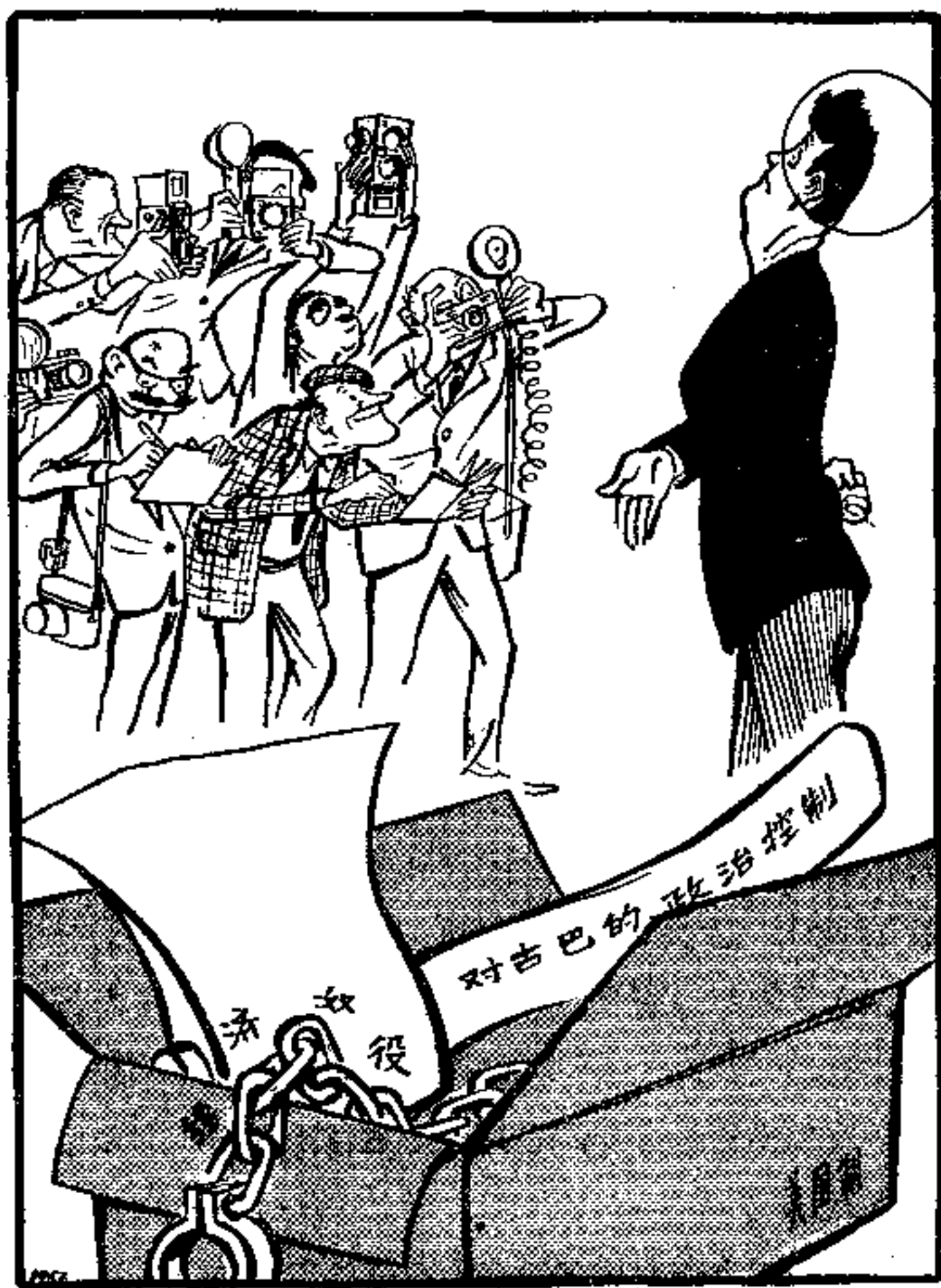
肯尼迪的“非进攻性”武器

古巴人民的英勇斗争不是孤立的。古巴人民的朋友遍于全世界。他们有着强大的社会主义阵营的支持，有着拉丁美洲各国人民的支持，有着亚洲、非洲和全世界一切爱好和平、主持正义的人民和国家的支持。六亿五千万中国人民是古巴人民最忠实最可靠的战友。我们永远同兄弟的古巴人民站在一起，并且从各个方面采取一切可能的步骤支持古巴。古巴革命事业已经取得了一系列的辉煌胜利，我们坚决地相信，古巴人民在全世界人民的支持下，依靠自己英勇顽强的斗争，一定能够粉碎美帝国主义的军事封锁和战争挑衅，一定能够取得革命事业的更大胜利。伟大的自由的古巴共和国将永远屹立于西半球！