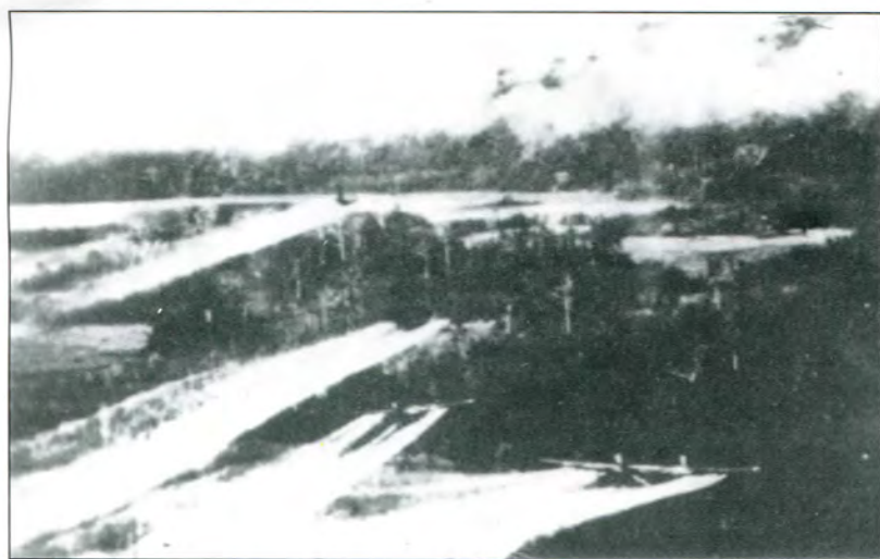
US planes spraying defoliants in South Vietnam.