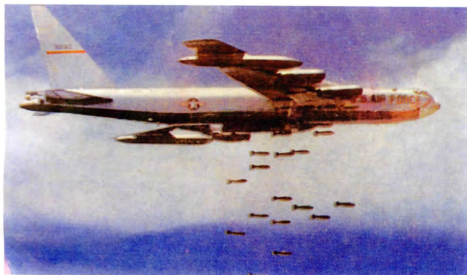
B.52s in the Vietnam sky.