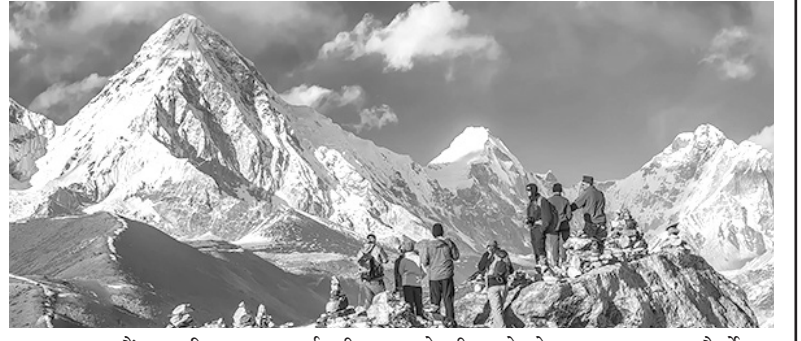
काठमाडौं। विश्वका पर्यटकीय लोन्ली प्लानेटले सन् २०२२ मा घुम्नेपर्ने १० गन्तव्यबारे जानकारी दिने ट्राभल गाइडबुक उत्कृष्ट गन्तव्यहरूको बाँकी ७ पेजमा

घुम्नेपर्ने १० उत्कृष्ट मुलुकको सूचीको टाँसो नम्बरमा नेपाल