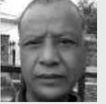
● कृषाभक्त महर्जन 'कोगड'