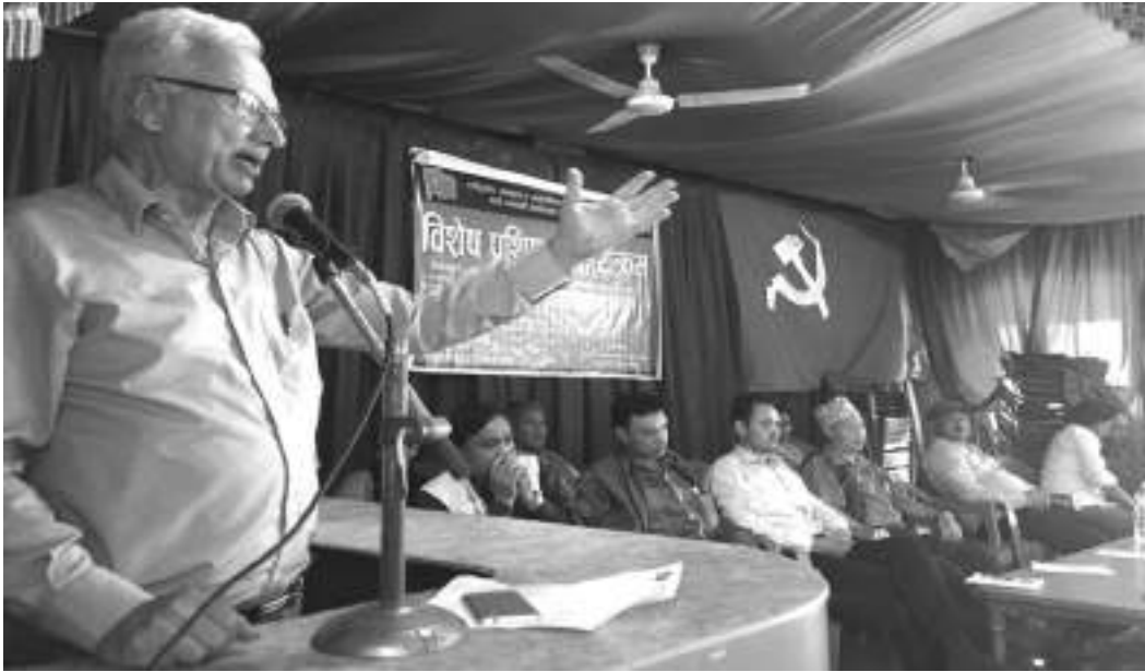
● वर्गदृष्टि संवाददाता

काठमाडौं । देशभक्त जनगणतान्त्रिक मोर्चा नेपालका केन्द्रीय अध्यक्ष सीपी गजुरेलले प्रधानमन्त्री केपी शर्माओली देशलाई सिक्किमीकरण गर्दै लाने भूमिकामा उद्वेगित हुँदै गएको ठोकुवा गर्नु भएको छ । जनगणतान्त्रिक मोर्चा नेपाल काठमाडौं जिल्ला समितिद्वारा शनिवार आयोजित एक विशेष प्रशिक्षण