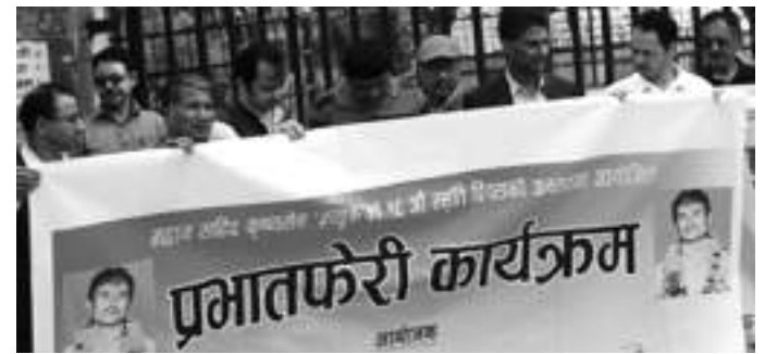
काठमाडौं । नेकपा (क्रान्तिकारी जनसँस्कृतिक महासंघ, क्रान्तिकारी माओवादी) निकट अखिल नेपाल पत्रकार महासंघ र... बाँकी ७ पेजमा