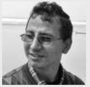
● हिरामण दुःखी ●

सिंहदरबार- १ सिंहदरबार ! जस्तो थियो पहिले छ, उस्तै अफै पनि फणा फूलाएकै छ कालीनागले ठिङ्ग उभिएर गरिरहेकै छ हुंकार निरन्तर निरन्तर सिंहासनबाट ।