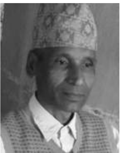
● इश्वर दुर्गेत

ज्ञान प्राप्त भनेको के हो ? र कसरी हुन्छ ?