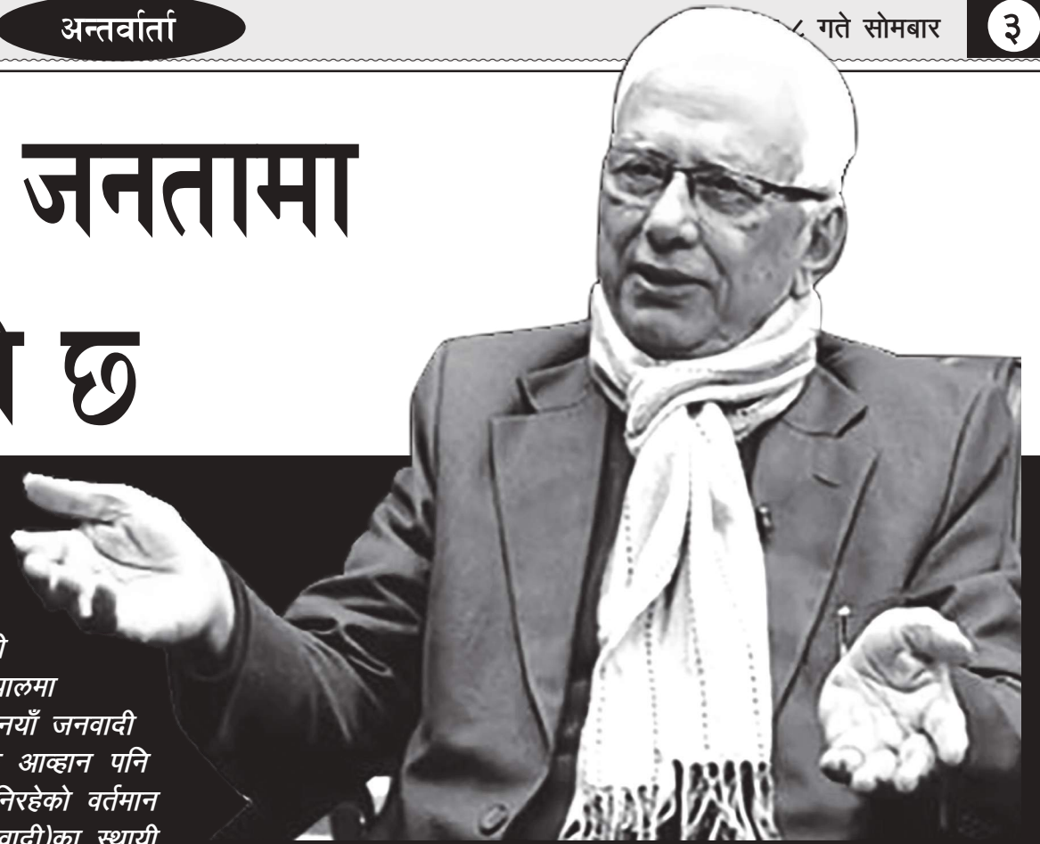
□ सीपी गजुरेल 'गौरव' अध्यक्ष, देशभक्त जनगणतान्त्रिक मोर्चा, नेपाल

(स्थानीय, प्रदेश र प्रतिनिधिसभाको निर्वाचनको देशभक्त जनगणतान्त्रिक मोर्चा, नेपालमार्फत् क्रान्तिकारी उपयोग गरेको नेकपा (क्रान्तिकारी माओवादी) अहिले तीन महिने संगठन तथा जनपरिचालन अभियानमा जुटेको छ । निर्वाचनपछि मैदान खाली गरेर सत्ताको खिचातानीमा लडिरहेका संसद्वादी पार्टीहरूको भण्डाफोर गर्दै फेरि पनि क्रान्तिकारी माओवादी सम्पूर्णरूपले जनतामा गएको छ । संसदीय व्यवस्थामा विरुद्ध नेपालमा फेरि पनि नयाँ जनवादी क्रान्तिको तयारीको उद्घोष गरिरहेको यो पार्टीले नयाँ जनवादी क्रान्तिका पक्षधर विभिन्न कम्युनिष्ट घटकसँग एकताको लागि सार्वजनिक आह्वान पनि गरेको छ । राष्ट्रियता, जनतन्त्र र जनजीविकाका समस्याहरू विकराल बनिरहेको वर्तमान अवस्थामा यिनै उल्लेखित विषयमा केन्द्रित रहेर नेकपा (क्रान्तिकारी माओवादी)का स्थायी समिति सदस्य तथा देशभक्त जनगणतान्त्रिक मोर्चा, नेपालका केन्द्रीय अध्यक्ष सीपी गजुरेलसँग गरिएको टेलिफोन संवादलाई यहाँ प्रस्तुत गरिएको छ । -स.)