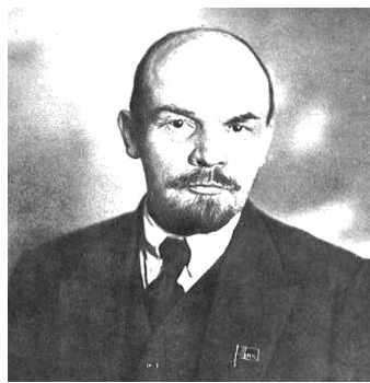
● लेनिन ●

“हामीले अहिलेसम्म मुख्यतया सचेत मजदूरहरूकै बीचमा काम गर्दै आएका छौं। सामान्य मजदूरहरूचाहिँ भण्डै पूरापूर आर्थिक सङ्घर्षमा व्यस्त रहेका छन्” -यो भनाइ गलत छ। यस प्रस्थापनालाई यस किसिमले प्रस्तुत गर्दा 'स्वभावोदा' को लागि स्वभाविक, सचेत मजदूरहरूलाई "जनसमूह" का विरुद्ध उभ्याउने प्रवृत्तिको रूप लिन पुग्दछ। हामीकहाँ सचेत मजदूरहरू त पछिल्ला वर्षहरूमा "भण्डै पूर्णतः आर्थिक सङ्घर्षमा व्यस्त" रहेका छन्। पहिलो कुरा यो हो। दोस्रो कुरा के हो भने त्यस बेलासम्म जनसमूहले राजनीतिक सङ्घर्ष चलाउन सिकेनछैन, जबसम्म हामीले सचेत मजदूरहरू र बुद्धिजीवीहरू दुवैको बीचबाट, यस सङ्घर्षका लागि नेताहरू प्रशिक्षित गर्न मद्दत गर्ने छैनौं। हाम्रो राजनीतिक जीवनका सबै दैनिक पक्षहरूलाई विभिन्न वर्गहरूले विभिन्न कारणले गर्ने विरोध र सङ्घर्षका सबै प्रयासहरूको व्यवस्थित मूल्याङ्कनद्वारा मात्र यस्ता नेताहरूको तालमी गर्न सकिन्छ। त्यसै कारणले "राजनीतिक सङ्गठन तयार गर्ने" कुरा गर्नु र यसको साथसाथै एक राजनीतिक अखबारको "कागजी काम" लाई "स्थानीय स्तरमा गरिने सजीव राजनीतिक कार्य" विरुद्ध