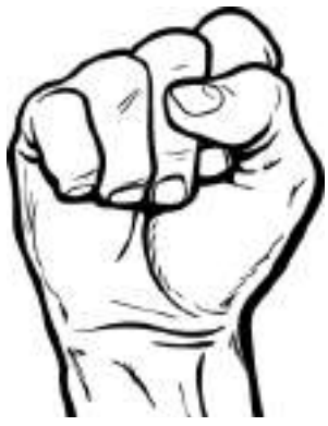
देजमोको चुनाव चिन्ह

अनेकिसंघ (क्रान्तिकारी)का केन्द्रीय संयोजक भूमिस्वर