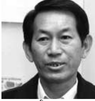
● परि थाप ●

संयुक्त अधिराज्य (बेलायत)लाई संसद र संसदीय व्यवस्थाको जन्मस्थानका रूपमा लिने गरिन्छ किनभने त्यहाँ राजनीतिक पार्टीहरू भन्दा पहिल्यै संसद र संसदीय व्यवस्था अस्तित्व थियो । यद्यपि अहिलेको जस्तो आकस्मिक निर्वाचन मार्फत संसदको गठन नभएर निश्चित सामन्तहरू सांसद वा संसदका सदस्य बन्दथे र तिनीहरूका नेता राजा हुने गर्दथे । कालान्तरमा आकस्मिक वा आमनिर्वाचनको प्रचलन शुरु भए पछि मात्र राजनीतिक पार्टीहरू अस्तित्वमा आएका हुन र त्यहाँ कन्जरभेटिभ (अनुदारवादी), लेबोर (श्रमिक) एवं उदारवादी गरी मुख्य तीन धारमा राजनीतिक पार्टीहरू रहेका छन् । बेलायतको संसदीय व्यवस्था १३ औं शताब्दीमा शुरु भएको थियो र अहिले सम्म आउँदा करिब ८०० वर्षा पुरानो भैसकेको छ । त्यहाँ प्रचलन र परम्पराहरूलाई नै कानुन निर्माणको आधार बनाइने हुनाले लिखित संविधान समेत छैन ।