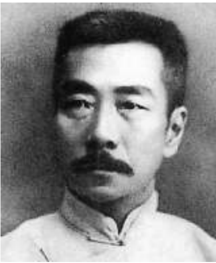
• लु सुन •