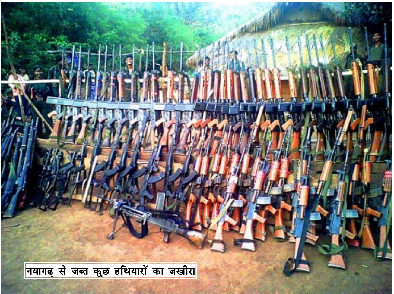
नयागढ़ से जब्त कुछ हथियारों का जखीरा

नयागढ़ आपरेशन ने जोड़ा इतिहास में नया पन्ना! चलायमान युद्ध की ओर पीएलजीए के बढ़ते कदम!!