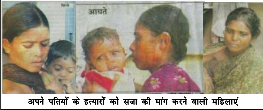
अपने पतियों के हत्यारों को सजा की मांग करने वाली महिलाएं