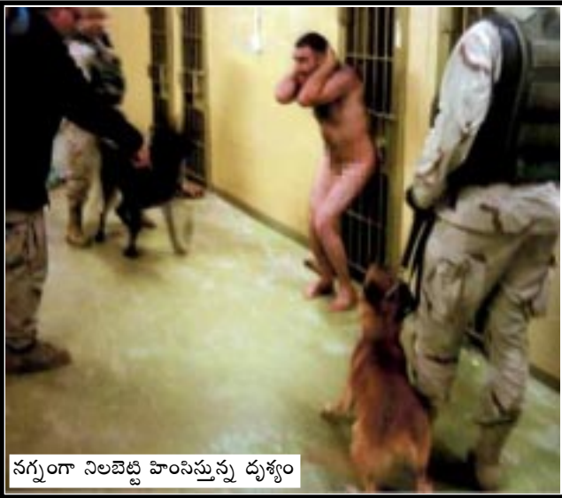
నగ్నంగా నిలబెట్టి హింసిస్తున్న దృశ్యం

డిసెంబర్ 2002 తర్వాత జరిగినవే. ఇలాంటి 35 కేసులపై విచారణ జరగగా వీటిలో 10 కేసులు బలాత్కారం, దాడి, గాయపర్చడం వంటివని తేలింది. గ్యాంపెనామా అఖాతంలో ఉన్న ఖైదీల సంగతైతే ఎవరికీ తెలియదు. జాతీయ భద్రత అనే ముసుగులో ఖైదీల గురించిన సమాచారాన్నంతా రహస్యంగా ఉంచారు. ఇక ఖైదీల పరిస్థితుల గురించి మాట్లాడనవసరమే లేదు. వాళ్లకు రక్షణనిచ్చే చట్టబద్ధమైన ప్రక్రియ ఏదీ లేదు. జెనీవా ఒప్పందం కూడా వాళ్లకు వర్తించదు.