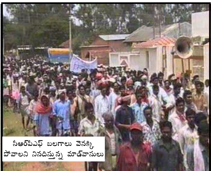
సీఆర్‌పీఎఫ్ బలగాలు వెనక్కి పోవాలని నిరదిస్తున్న మాడ్‌వాసులు

మావేనని ఆ గ్రామ ప్రజలు నొక్కి చెబుతున్నారు. స్వాతంత్ర్యం వచ్చిందని 57 ఏళ్లుగా చెబుతున్నప్పటికీ నేటికీ బస్తర్ ప్రజలు మందులు దొరక్క చిన్న చిన్న రోగాలతో ప్రాణాలు విడవడం ఈ ప్రభుత్వం ఒప్పుకున్నా ఒప్పుకోకపోయినా ఒక కఠోర వాస్తవం. అందుకే ఇక్కడ సంఘటిత పడుతున్న విప్లవోద్యమం అనేక ఏళ్లుగా సాగిస్తున్న కృషి ఫలితంగా కొన్ని గ్రామాల్లో ప్రజలు తమంత తాముగానే ప్రజా ఆలోచన కేంద్రాలు ఏర్పాటు చేసుకొని, మందులు సేకరించుకొని వైద్య చికిత్స పొందుతున్నారు. పార్టీ, విప్లవ ప్రజా సంఘాలు ప్రతి గ్రామంలోనూ