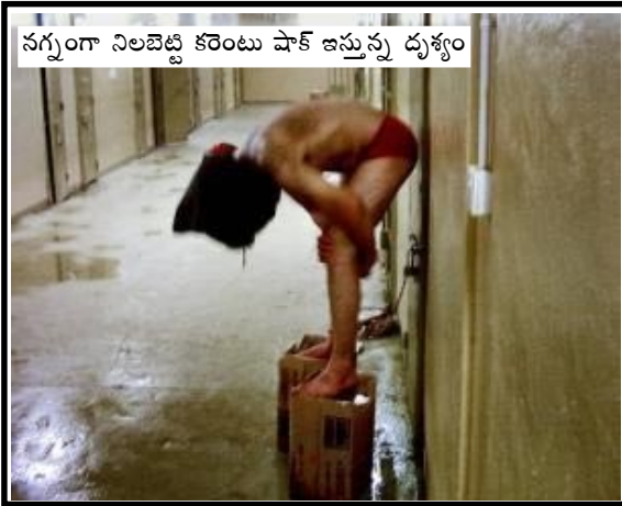
నగ్నంగా నిలబెట్టి కరెంటు షాక్ ఇస్తున్న దృశ్యం

ఈ "మతిభ్రమణ సిద్ధాంతాన్ని" విభేదిస్తూ మరిన్ని వాస్తవాల వెలుగులోకి వచ్చాయి. 37 మంది ఇరాకీ, ఆఫ్ఘన్ ఖైదీలు అమెరికన్ కస్టోడియన్లలో మరణించారని రక్షణ శాఖ అధికారులు ఒప్పుకున్నారు. ఇవన్నీ