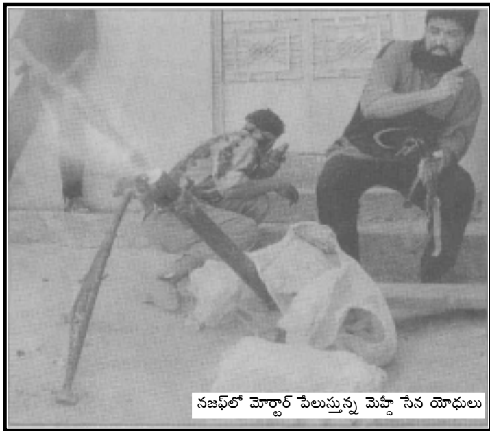
నజఫ్ లో మోర్టార్ పేలుస్తున్న మెహ్దీ సేన యోధులు