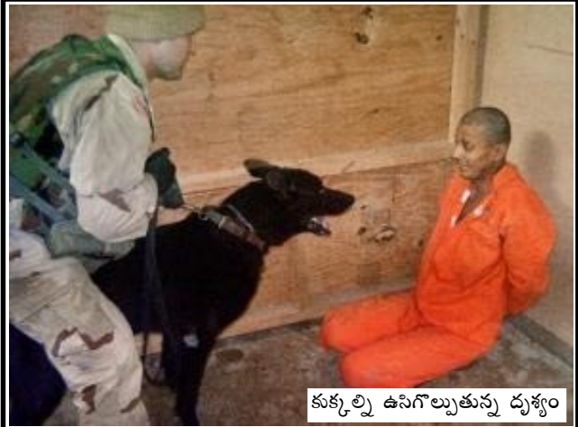
కుక్కల్ని ఉసిగొల్పుతున్న దృశ్యం