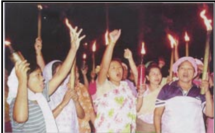
నల్లచట్టాలను రద్దు చేసే దాకా మా పోరు ఆగదంటున్న "కాగడాధారి మహిళలు"

ఈ ఉద్యమాలను అణచివేయడానికి పాలకవర్గాలు నల్ల చట్టాలను ఆశ్రయించి క్రూర నిర్బంధ విధానాలకు పూనుకున్నాయి. వేల సంఖ్యలో భద్రతా బలగాలను మోహరించి వాటికి విచ్చలవిడి అధికారాలిచ్చాయి. భద్రతా బలగాలు సాధారణ ప్రజలపైన తమ పశు బలాన్ని ప్రయోగిస్తూ విచ్చలవిడి హింసాత్మక చర్యలకు పాల్పడుతున్నాయి. ఈశాన్య ప్రాంతంలో సాగుతున్న ఉగ్రవాద ఉద్యమాలను అణచివేయడానికి ఏఎఫ్ఎస్ఎఫ్, కల్లోలత ప్రాంత చట్టం లాంటి నల్ల చట్టాలను అమలు చేయాల్సి వచ్చిందని