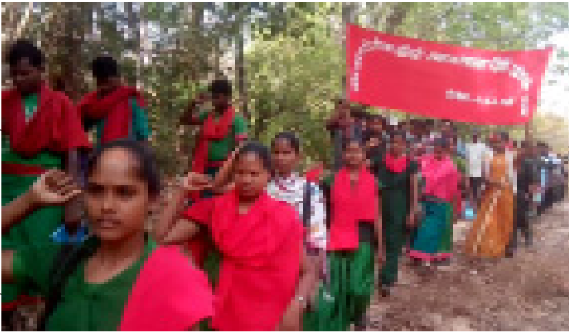
దక్షిణ బస్తర్ డివిజన్ క్రాంతికారి జనతన సర్కార్ 4వ ప్రతినిధుల సభ క్యాలీ

సమీక్షించుకుని, నూతన కర్తవ్యాలను రూపొందించుకోవడం, అలాగే నూతన నాయకత్వాన్ని ఎన్నుకోవడం లక్ష్యంగా జరిగిన ప్రతినిధుల సభలను విజయవంతమయ్యాయి. ప్రకృతి వనరులను, వ్యవసాయాన్ని కాపాడుకోవడంలో భాగంగా తమ మాన