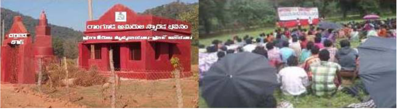
జులై 28, 2017 అమరుల వారోత్సవాల సందర్భంగా, రాంగూడ అమరుల జ్ఞాపకార్థం, గురుశెట్టి చౌక్ వద్ద స్మారక భవనాన్ని నిర్మించుకొని, 10 వేల మందితో బహిరంగ సభను జరుపుకున్న విప్లవ ప్రజానీకం

ఎ.బి.టి.లో విప్లవోద్యమాన్ని పురోగమింపచేసే కృషిలో, 2016 జూలై నుండి 2017 జూలై వరకు వివిధ స్థాయిలకు చెందిన 36 మంది కామ్రేడ్స్ తమ రక్త తర్పణతో మన విప్లవ మార్గాన్ని మరింత ప్రకాశవంతం చేసి, ఎర్రజెండాను ఎరుపెక్కించి, పోరాడే ప్రజలకు మార్గదర్శకులుగా, పదనిర్దేశకులుగా, ఆదర్శప్రాయులుగా నిలిచారు.