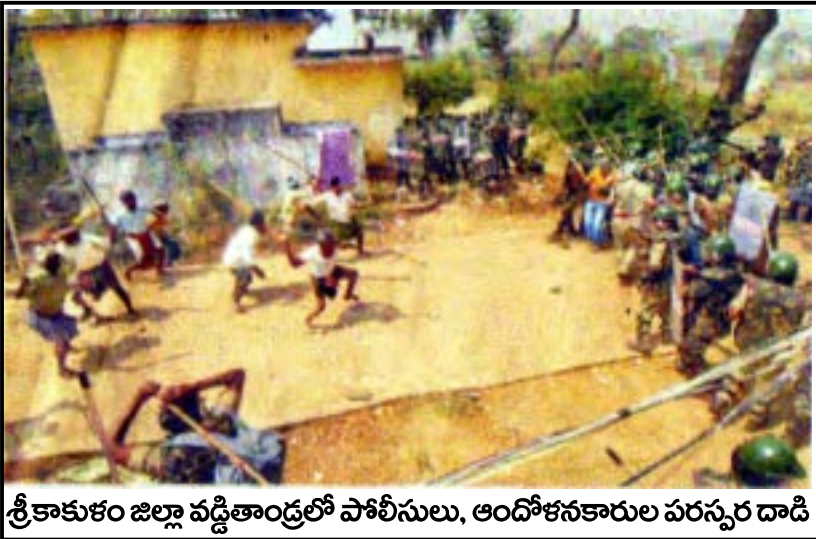
శ్రీకాకుళం జిల్లా వడ్డితాండ్రలో పోలీసులు, ఆందోళనకారుల పరస్పర దాడి

సోంపేట ఘటన అనంతరం పరిస్థితుల అధ్యయనానికి బెంగుళూరు కేంద్రంగా పనిచేస్తున్న పర్యావరణశాఖ ఆధ్వర్యంలో ఒక బృందం వచ్చి జూలై 2010లో 17-19 తేదీల మధ్య ఇక్కడ పర్యటించి 13 పేజీల వివరం రాసింది. అందులో 5 అంశాలను స్పష్టపరిచింది. 1. ప్రజలు, మత్స్యకారులు పూర్తిగా ప్లాంట్ ను నిర్మాణాన్ని వ్యతిరేకిస్తున్నారు. 2. ఈ ప్లాంట్ ను వలస నీటి ముంపు వచ్చి పొలాలు మునిగి పోతాయి. మరో కాలంలో (వంట కాలంలో కూడా) నీటి నష్టం ఎదుర్కొంటారు. 3. నీటి ప్రవాహాలు మారిపోయి 30వేల ఎకరాలకు ముంపు ప్రమాదం ఉంది. 4. ఇవి చిత్తడి నేలలే.