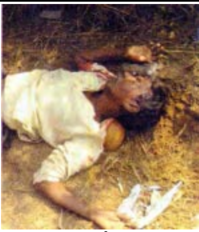
బుల్లెట్ దెబ్బకు నేలరాలిన రైతు