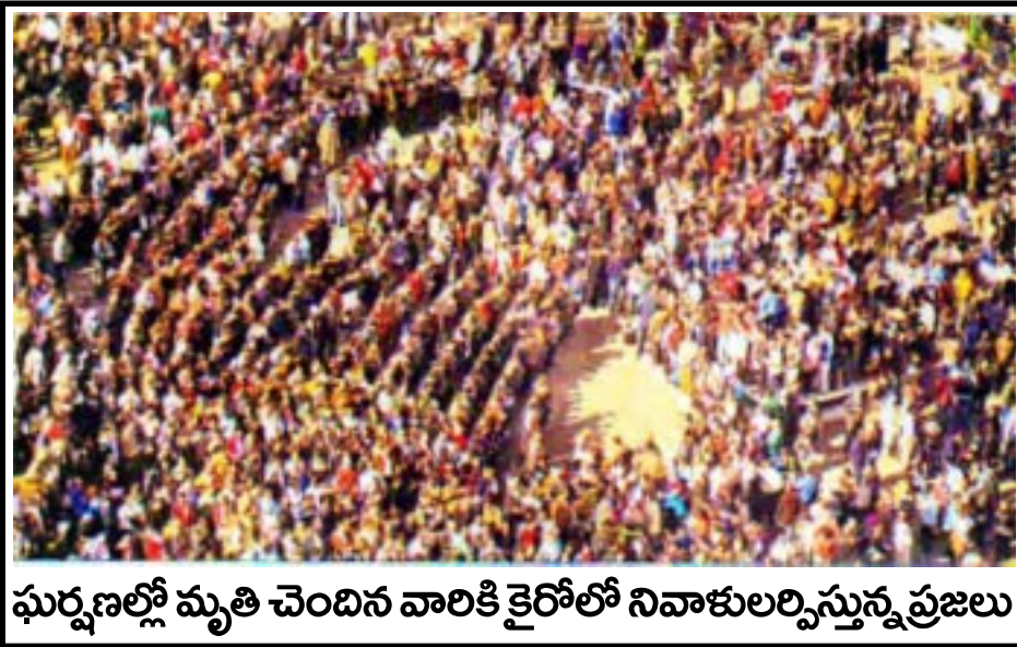
ఘర్షణల్లో మృతి చెందిన వారికి కైరోలో నివాళులర్పిస్తున్న ప్రజలు

మానవజాతి చరిత్రలో నైలు నది తీరంలో ఈజిప్ట్ ఒక పురాతన నాగరిక సమాజం. అది ఈనాడు ఆర్థిక, రాజకీయ సంక్షోభంలో కొట్టుమిట్టాడుతుంది. ఈజిప్ట్ పరిణామక్రమంలో గతం, వర్తమానం రెండూ చరిత్రలో నిలిచిపోతాయి. మొదట విజయం సాధించిన ట్యూనీషియా ప్రజాందోళన ఈజిప్ట్ ప్రజాందోళనకు, విజయానికి దారితీసింది. ఈ విజయాలు నేడు ఉత్తరాఫ్రికా, పశ్చిమాసియాలను గొప్పగా కుదిపేస్తున్నాయి. యెమెన్, అల్జీరియా, జోర్డాన్, యొర్డాన్, సిరియా, లిబియా, బహ్రైన్ దేశాలుగా నియంత్రత్వ పాలనను అనుభవిస్తున్న దేశాలు. ఇవేకాదు ఇంకా అనేక దేశాలు నియంత్ర పాలనలోనే