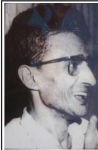
కామ్రేడ్ చారుమజుందార్ సి.పి.ఐ. (మావోయిస్టు) వ్యవస్థాపకులు

నిరంకుశ పెట్టుబడిదారుల దోపిడీ అధికం కాసాగింది. మరోవైపు దేశంలో అప్పటికే కరడుగట్టి వున్న భూస్వామ్య వ్యవస్థ చెక్కు చెదరకుండా తన దోపిడీని యధేచ్ఛగా కొనసాగింది. ఈ మూడు దోపిడీ వర్గాల పీడనలతో ఉక్కిరి బిక్కిరయిన ప్రజలకు స్వాతంత్ర్యపు మేడిపండు స్వభావం స్పష్టంగా అర్థమయింది. వాళ్లలో నిజమైన స్వాతంత్ర్యాన్ని సాధించాలనే ఆశయం రగిలింది. అయితే ఆ స్వాతంత్ర్యేచ్ఛను సరైన మార్గంలో మళ్లించగలిగిన కార్మికవర్గ పార్టీ లేని పరిస్థితి.