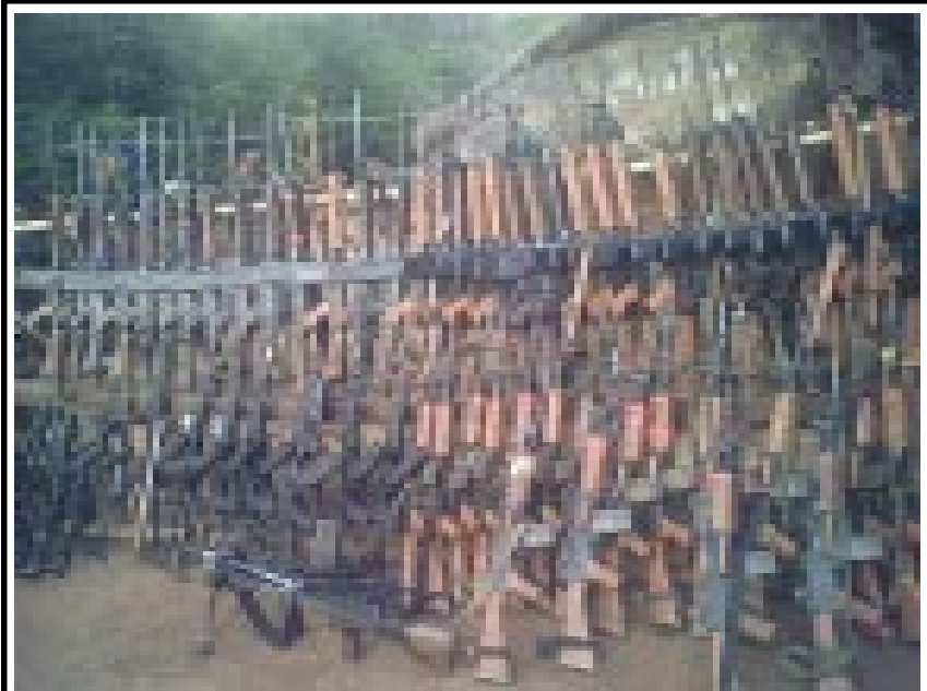
స్వాధీనం చేసుకున్న ఆయుధాలు

తీసుకుని పి.టి.ఎస్, ఆర్మీలోని 1200 తుపాకుల్ని, 1 లక్షా 75 వేల తూటాల్ని స్వాధీనం చేసుకున్నారు. ఈ దాడిలో ప్రతిఘటనకు ప్రయత్నించిన 14మంది పోలీసులను గెరిల్లాలు మట్టి కరిపించారు. దాడిలో భాగంగా రోడ్డు బ్లాక్ కోసం దస్పల్లాలోని ఒక గ్యారేజి నుండి టైరు తీసుకెళుతున్న గెరిల్లాలపై బి.జె.పి గూండాలు