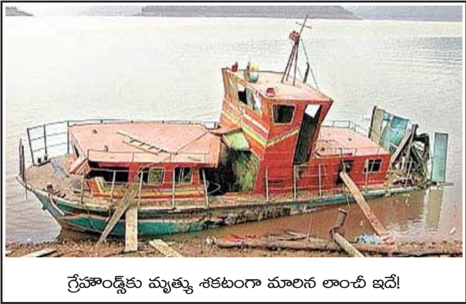
గ్రేహౌండ్స్ కు మృత్యు శకటంగా మారిన లాంచీ ఇదే!

దీనికి కావాల్సిన కౌంటర్ ఇన్ సర్జెన్సీ ఎత్తుగడలనూ, పథకాలనూ, సమాచారాన్ని ఎ.పి.ఎస్.ఐ.బి. సమకూర్చుతుంది. ఈ రెండు హంతక సంస్థలు కల్పి ఎసి రాష్ట్ర ప్రజల జీవితాల్లో ఎన్నో పీడకలలను గుమ్మరించాయి. భూస్వామ్య, దళారీ నిరంకుశ బూర్జువా, సామ్రాజ్యవాదుల అధికారాన్ని నిలబెట్టడం కోసం అవి ప్రజలపై లెక్కలేనన్ని హత్యలూ, అత్యాచారాలకూ పాల్పడ్డాయి. కేంద్ర కమిటీ సభ్యుల నుంచి సానుభూతిపరుల వరకూ వందల సంఖ్యలో హత్యలకు పాల్పడ్డాయి. ఈ రెండు సంస్థలు ఎంతగా రాజ్యాంగేతర సంస్థల వలె వ్యవహరిస్తున్నాయంటే ఏ హద్దులూ లేకుండా ఇతర రాష్ట్రాల్లోనూ తమ హత్యాకాండను కొనసాగిస్తున్నాయి. ఎ.పి.ఎస్.ఐ.బి. ఆంధ్రప్రదేశ్ ఇతర మరెన్నో రాష్ట్రాల్లో వల పన్ని పార్టీ నాయకత్వాన్ని పట్టుకొని అరెస్టులూ, హత్యలు చేస్తే; ఎ.పి. గ్రేహౌండ్స్ పొరుగున వున్న ఒడిస్సా, ఛత్తీస్ గఢ్ రాష్ట్రాల్లో దాడులు చేసి డజన్ల సంఖ్యలో విప్లవకారులను పొట్టన పెట్టుకుంది.