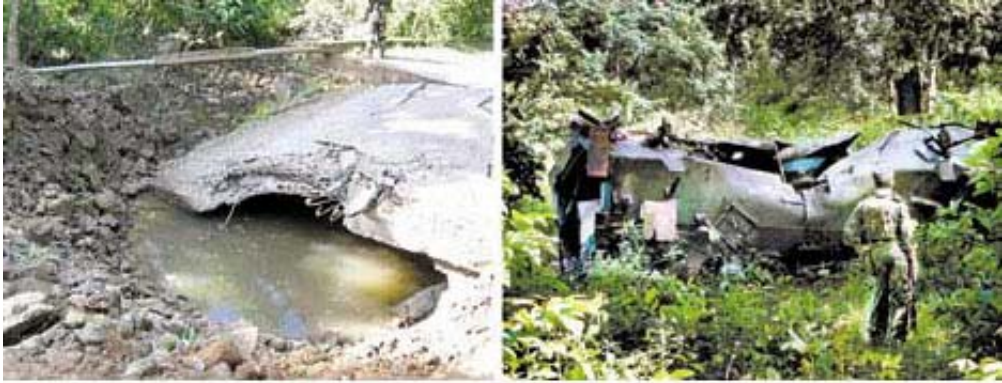
మల్కన్గిరిలో మందుపాతరకు ధ్వంసమైన కల్వర్టు పేలుడు ధాటికి ఎగిరి రోడ్డుకు దూరంగా పడిన పోలీసుల మైన్ పూఫ్ వాహనం

ఈ సమాచారం తెలుసుకున్న ఎస్.బి.జి. జవాన్లు జూలై 16 సాయంత్రం మల్కన్గిరి జిల్లా హెడ్ క్వార్టర్ల నుండి ఆంటీ ల్యాండ్ మైన్ వాహనంలో వచ్చి, రోడ్డు మీద వున్న అడ్డంకులను తొలగించి తిరిగి వెళ్తుండగా పి.ఎల్.జి.ఎ. సాయంత్రం 5 గంటలకు ఆంబుష్ చేసింది. శక్తివంతమైన మైన్ ను పేల్చడం వల్ల ఆంటీ ల్యాండ్ మైన్ పూఫ్ వాహనం నుజ్జు నుజ్జయిపోయి