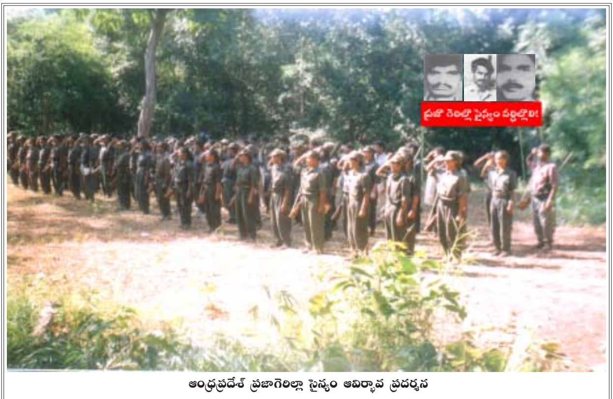
ఆంధ్రప్రదేశ్ ప్రజాగెలల్లా సైన్యం ఆవిర్భావ ప్రదర్శన