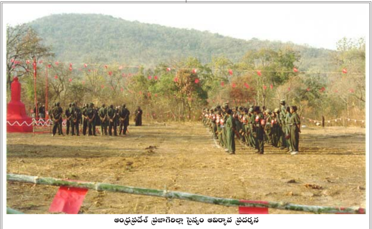
ఆంధ్రప్రదేశ్ ప్రజాగెరిల్లా సైన్యం ఆవిర్భావ ప్రదర్శన