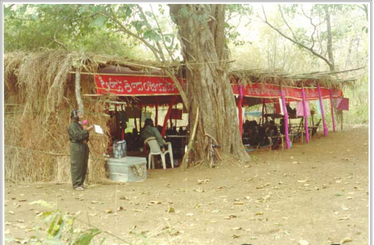
సమావేశంలో 9వ కాంగ్రెస్