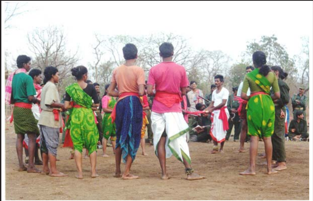
ప్రజాగెలల్లా సైనికుల సాంస్కృతిక ప్రదర్శన