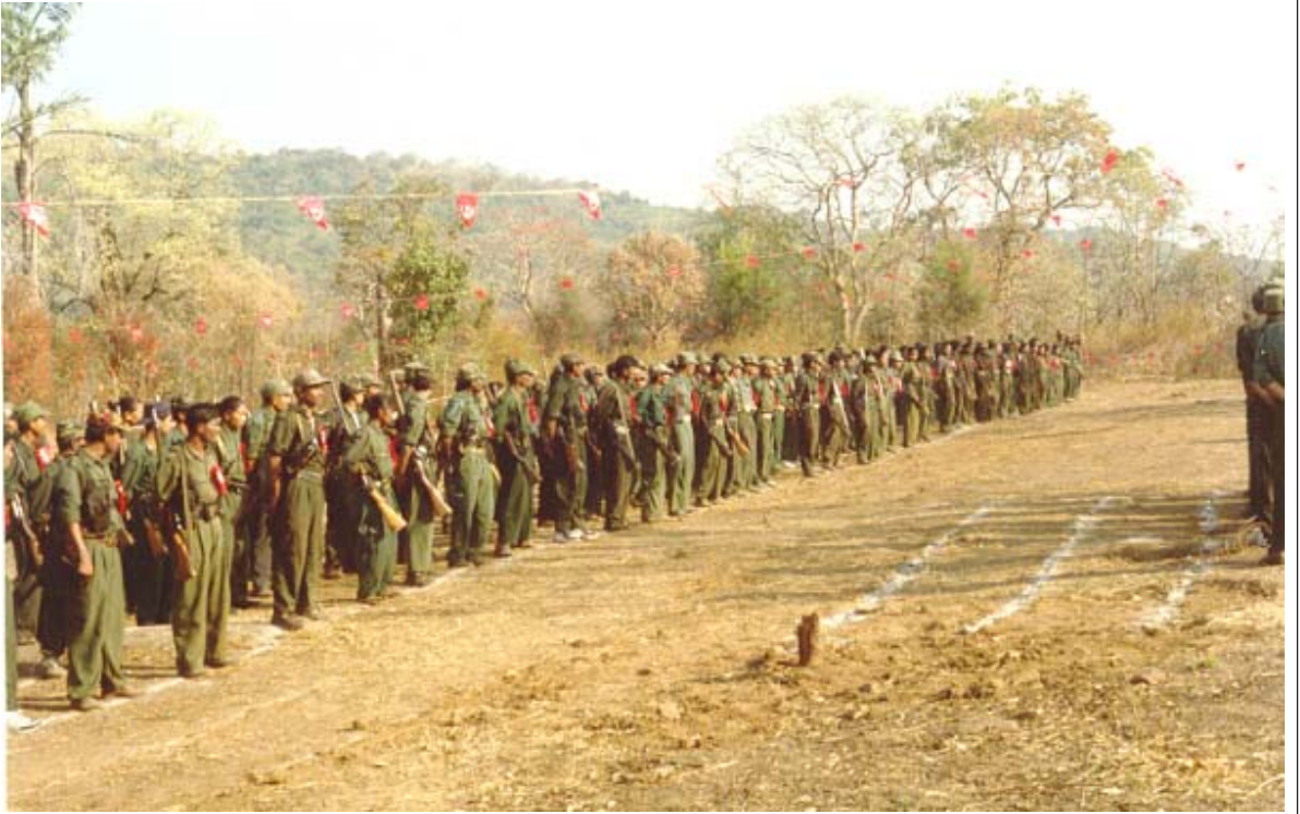
సి.పి.ఐ. యం-యల్ [పీపుల్స్ వార్] మహాసభల్లో పి.జి.ఐ. యోధులు