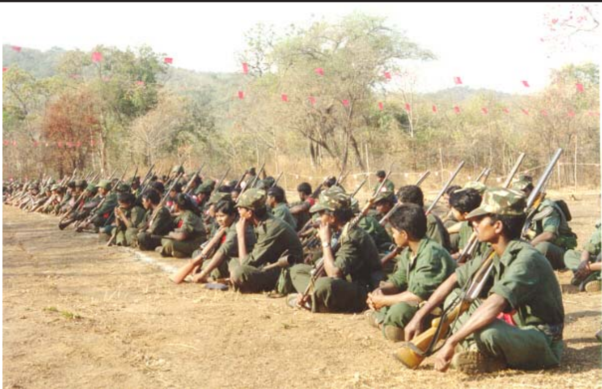
కాంగ్రెస్ ముగింపు కార్యక్రమంలో సి.పి.ఐ. యం-యల్ [పీపుల్స్ వార్] కార్యదర్శి ప్రసంగాన్ని వింటున్న పి.జి.ఐ. యోధులు