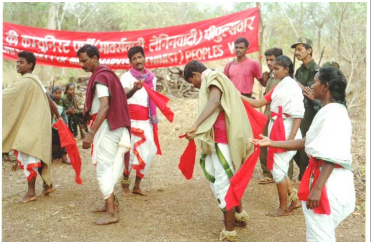
మహాసభల్లో సాంస్కృతిక ప్రదర్శన