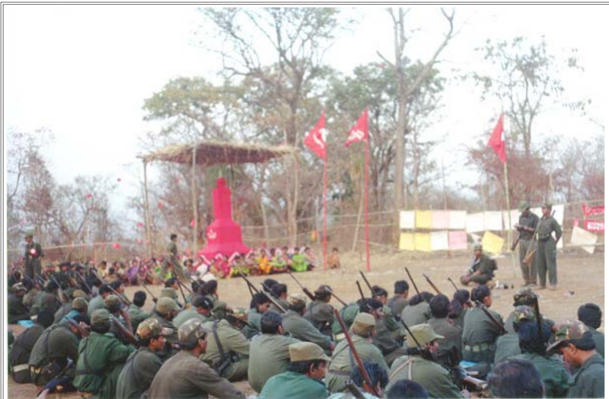
మార్చి 8. కాంగ్రెస్‌లో అంతర్జాతీయ మహిళా దినం సభ

వ్యతిరేకంగా పోరాటాలను నడపటానికి సంసిద్ధమవ్వాలి.