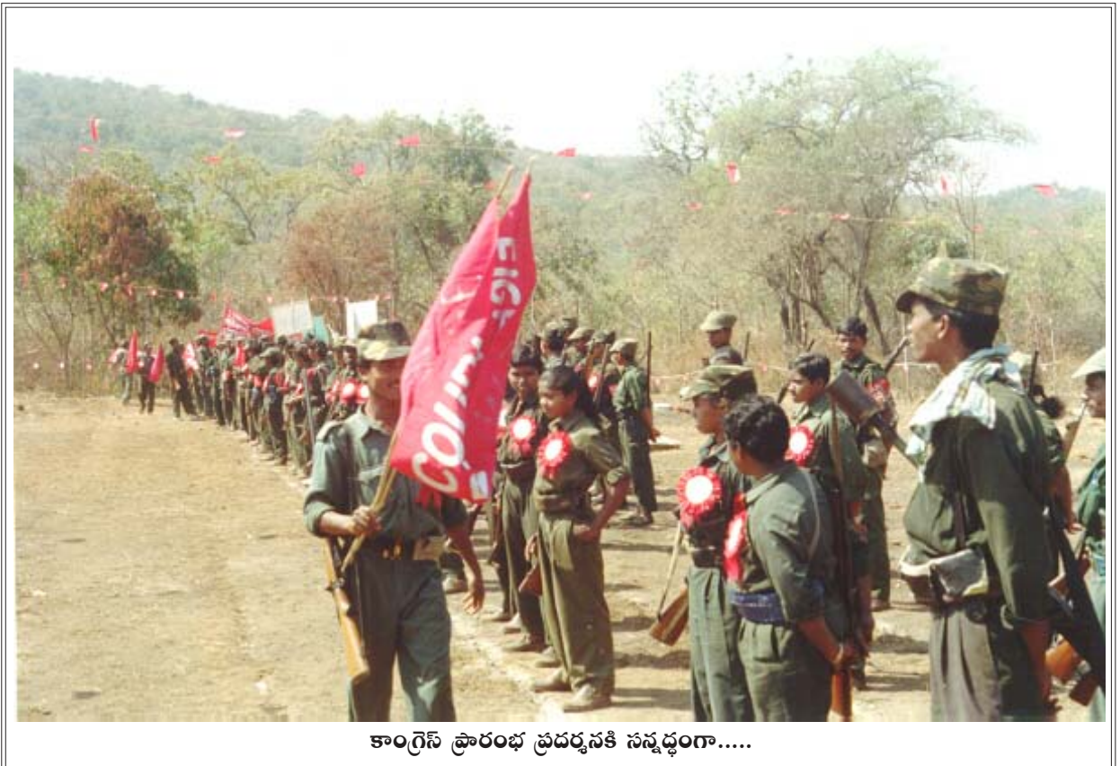
కాంగ్రెస్ ప్రారంభ ప్రదర్శనకి సన్నద్ధంగా.....