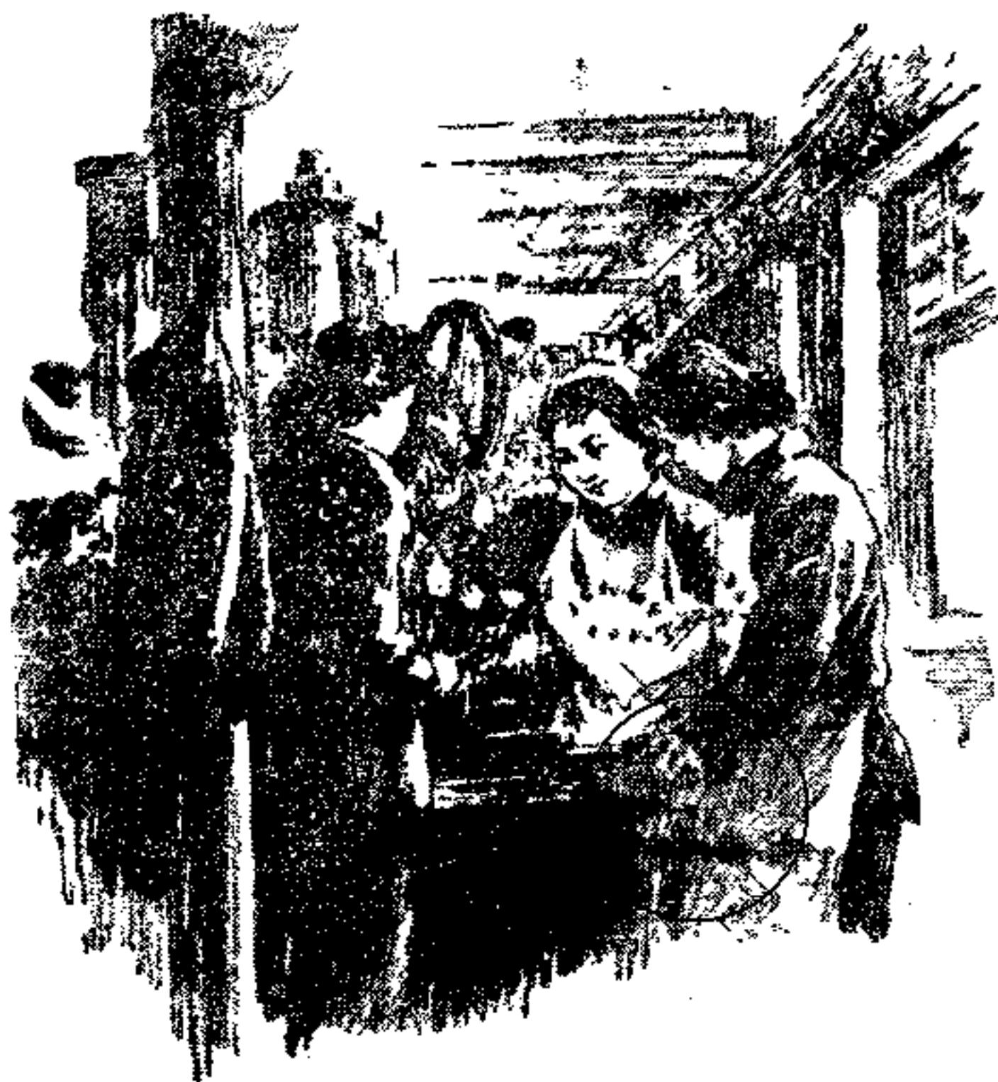
勤学苦练，革新技术