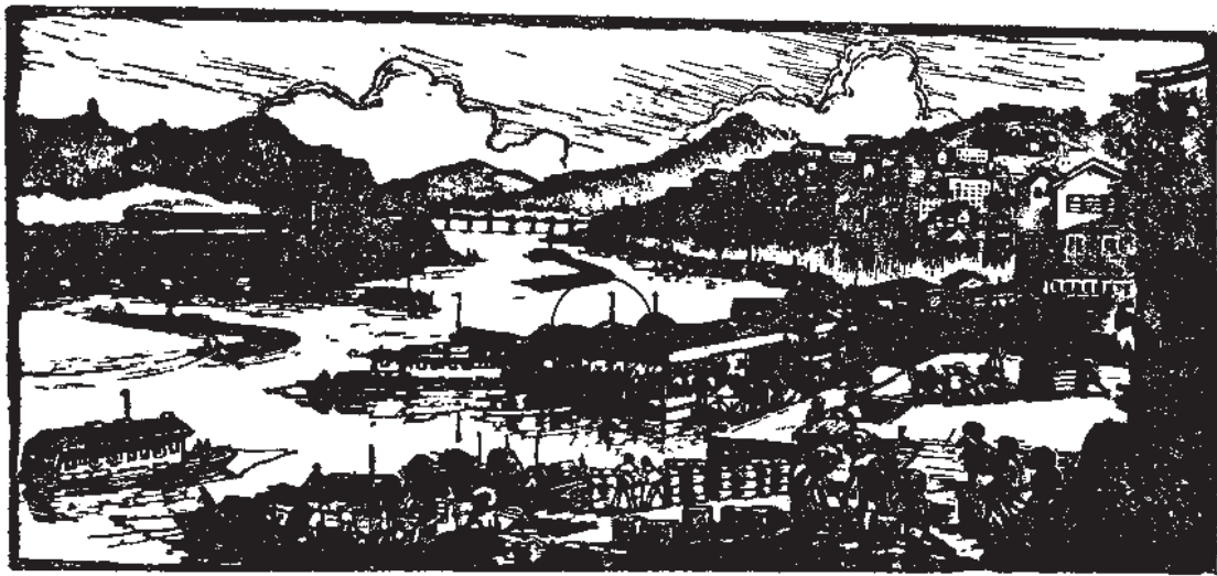
繁荣的山城——南平（木刻）

胡钧同志的文章，用不少的篇幅说明了利用价值形式和价值规律的重要意义。但是，由于他否认全民所有制经济内部存在商品生产，竟把价值规律看作电子计算机一类的东西，认为由于它有“良好作用”，才不可忽视。我是不同意这种意见的。这种意见，在客观上会妨碍我们认识价值规律和更好地利用商品生产为社会主义建设服务。