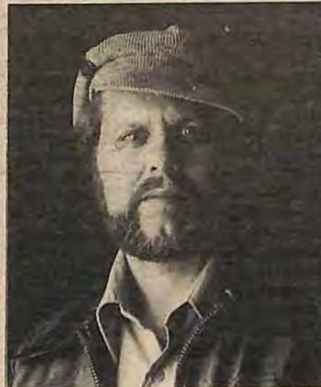
Una excerpta de un discurso por Bob Avakian, Presidente del Comité Central del Partido Comunista Revolucionario, EEUU Cleveland, 1979