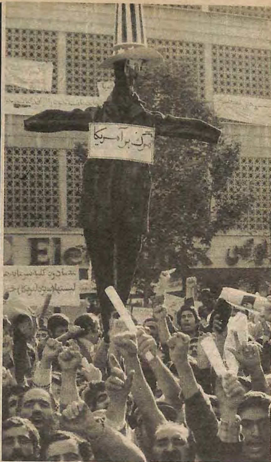
Frente a la Embajada EU el noviembre pasado poco después de ser capturada.

Extraña "neutralidad" en la que estos mafiosos imperialistas ávidos de sangre están metidos hasta la coronilla. Y en