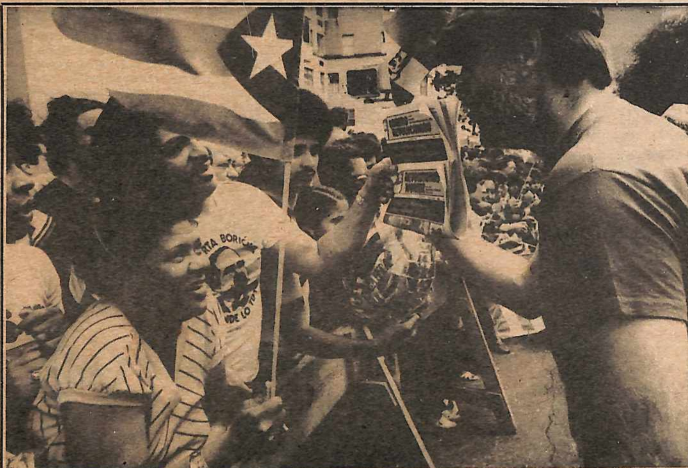
Vendiendo el OR en el Día de Puerto Rico en Nueva York.

prolongado que no tiene la T.N.T. Una vez que se ha nucleado un sitio, la gente y la propiedad que se queman en ese momento, son realmente sólo una pequeña parte del problema. Los defectos de nacimiento, el cancer, las mutaciones que ocurren entre las pestes y la bacteria que podrían permitirles multiplicarse y atacar más efectivamente al hombre, y los abastecimientos de comestibles, inclusive la tierra, los cuales se volverían venenosos por muchas generaciones—éste es el precio de las bombas Pase a la página 16