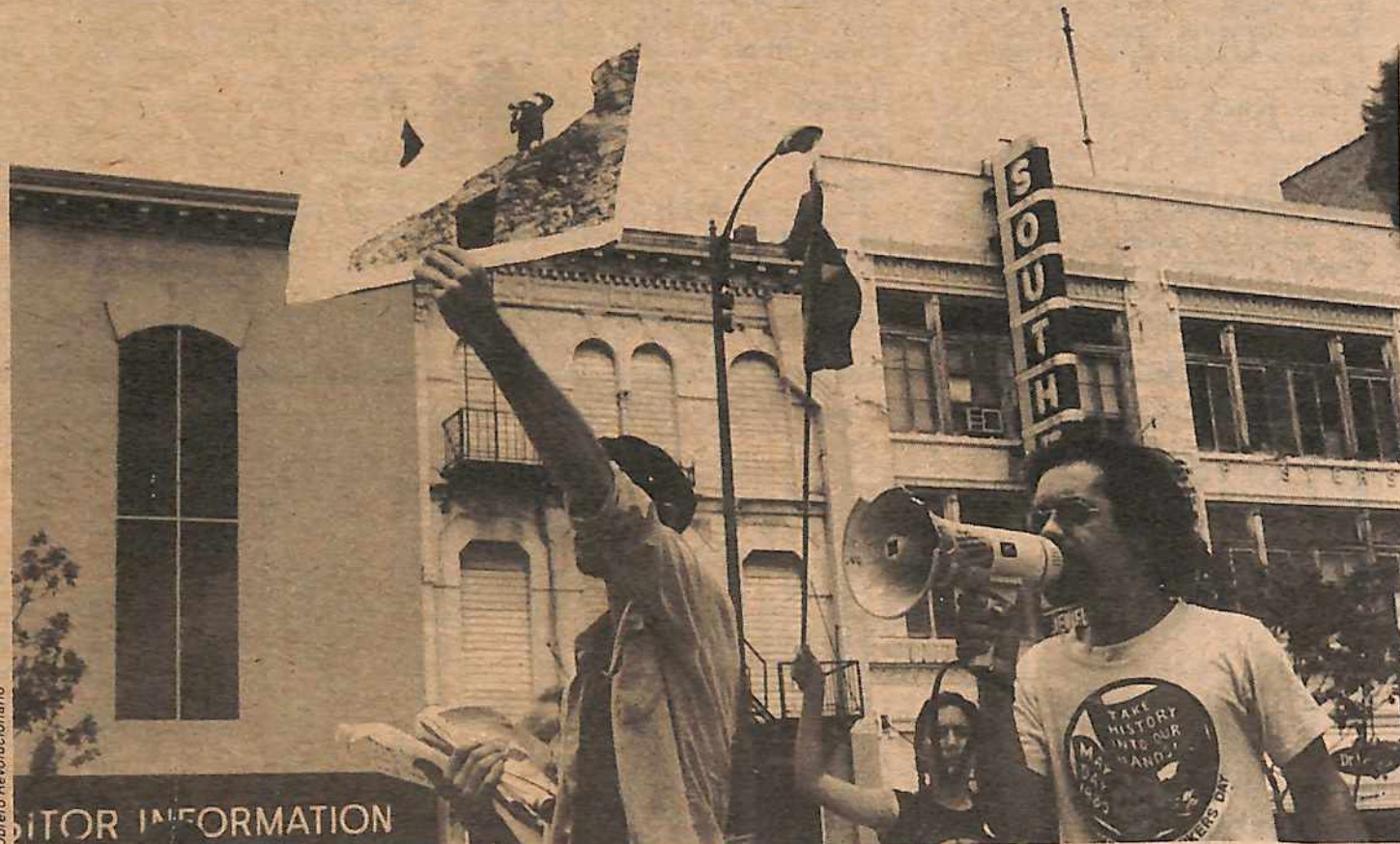
San Antonio, lugar del Alamo, el día de apertura del juicio.

El primer acto del juez fue ordenar que se sacara la bandera roja de la sala de justicia. Pronto fue puesta a la entrada de la sala con un centinela, donde permaneció durante el procedimiento de ese día. Mientras tanto, los marranos frustrados hicieron todo lo posible por intimidar a la gente, jugando con sus cachiporras escondidas en sus pantalones, y diciendo cosas como: "¡Matar, matar!" y diciéndole a un hombre: "Tu eres