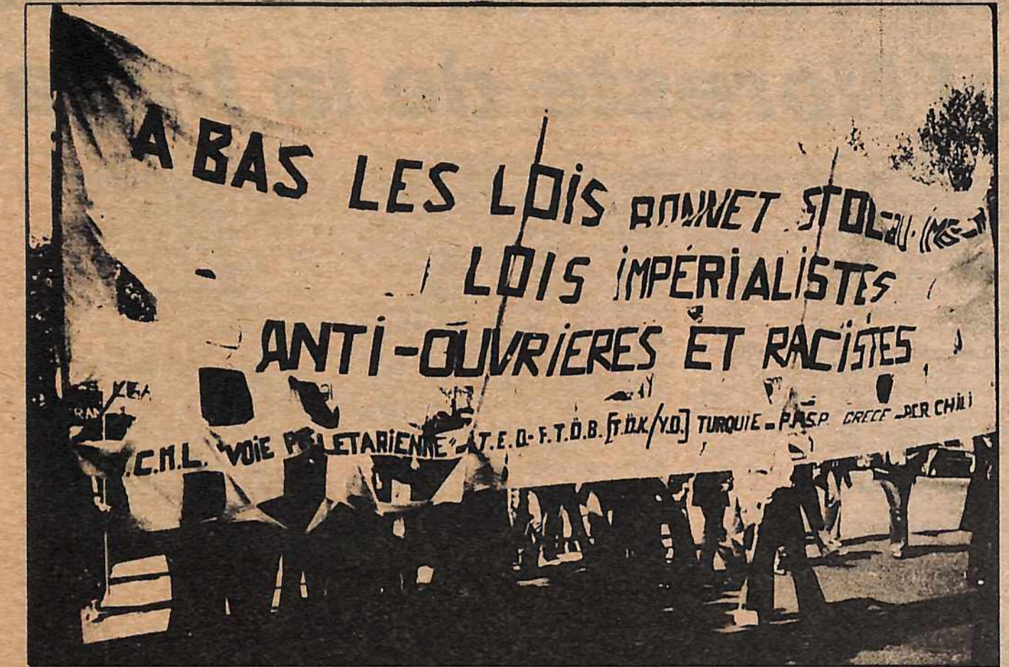
Pour Le Parti

Es también excelente ver que más organizaciones y manifestantes han hecho propias la idea de que las leyes Bonnet-Stoleru no son únicamente leyes racistas, sino que son especialmente dirigidas contra la clase obrera, con el objetivo de debilitar a la clase obrera de Francia en su totalidad, independiente de su nacionalidad. Esto sólo puede animarnos a persistir en la lucha que venimos librando con consistencia para denunciar este hecho, lo cual es tan indispensable para dar un con-