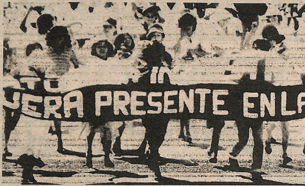
Parte de la marcha del 28 de noviembre de más de 10.000 personas contra el régimen sanguinario de la junta.

La marcha de FENASTRAS fue la primera gran marcha dirigida por los obreros desde que el actual gobierno tomó el Poder el 15 de octubre, declarando estado de sitio y suprimiendo ferozmente la lucha de las masas populares. La junta ha tratado mediante promesas demagógicas de alzos de paga de 100%, cuidado de la salud, viviendas, etc., de mantener a los obreros fuera de la lucha política en contra de su dominio. Pero ésta mandó al diablo a ellos y sus promesas.