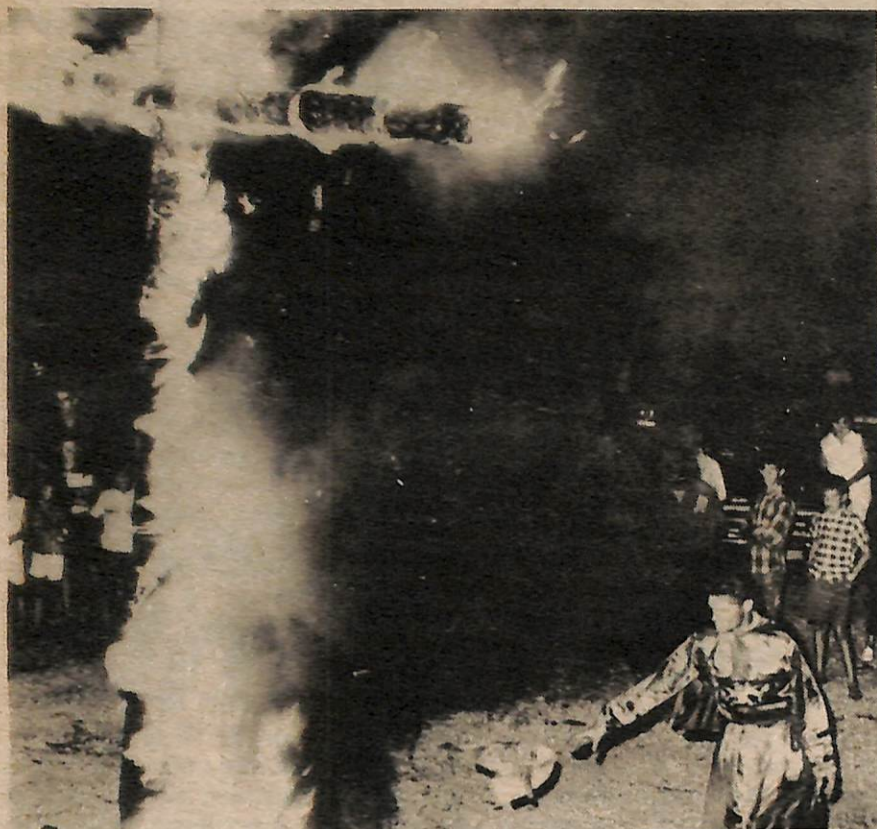
Cruces en llamas y el terror klanista en Chester, S.C., 1965.

La película "Nace una Nación", basada en novelas como The Clansman ( El Klanista ) y otras, fue el éxito económico más grande de Hollywood, hasta aparecer la igualmente reaccionaria "Gone With the Wind" ( Lo que el Viento se Llevó ).