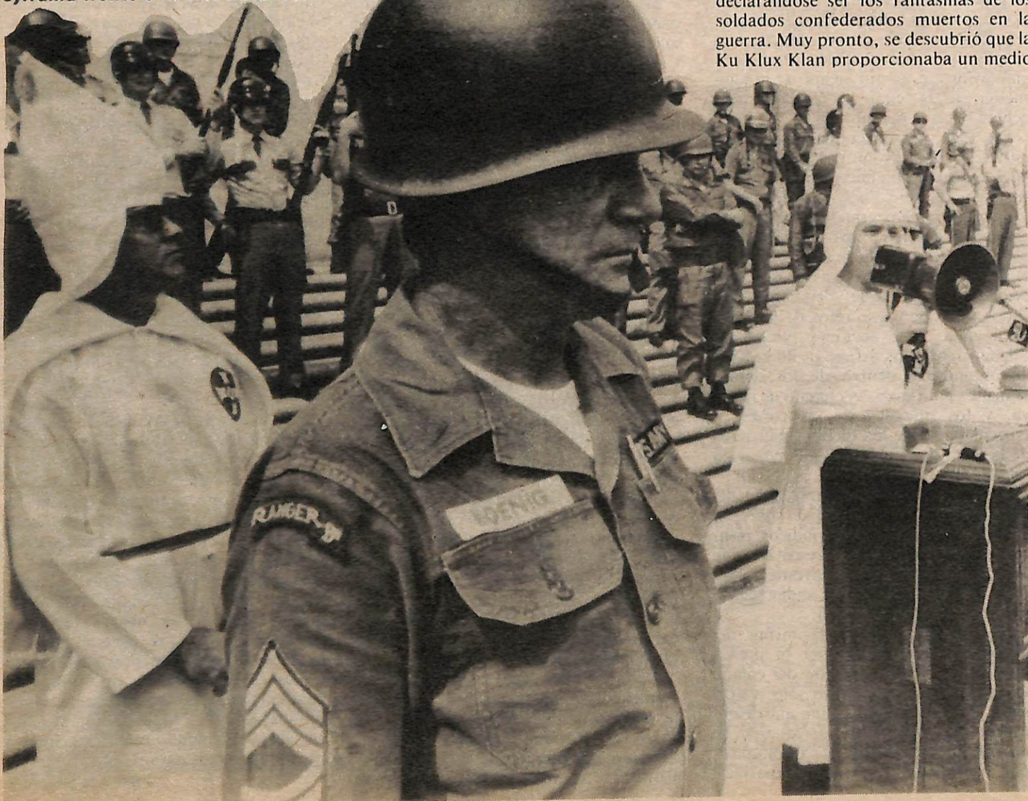
Klanistas y sus guardaespaldas gubernamentales en Atlanta, 1965.

Desde los primeros ruidos reaccionarios de los cascos de los jinetes enmascarados en los caminos sureños de regiones subdesarrolladas, después de la derrota de la esclavitud durante la Guerra Civil, hasta el masacre de Greensboro, las actividades terroristas de la Ku Klux Klan han sido disimuladas por la prensa capitalista bajo un velo de misterio y mentiras. La burguesía bien tiene razón por hacerlo, pues al arrancarle las sábanas, se revela que la Klan ha estado a las órdenes del capitalismo estadounidense desde sus primeros días.