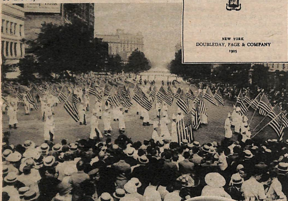
La Klan desfila por la Avenida Pennsylvania frente a la Casa Blanca.