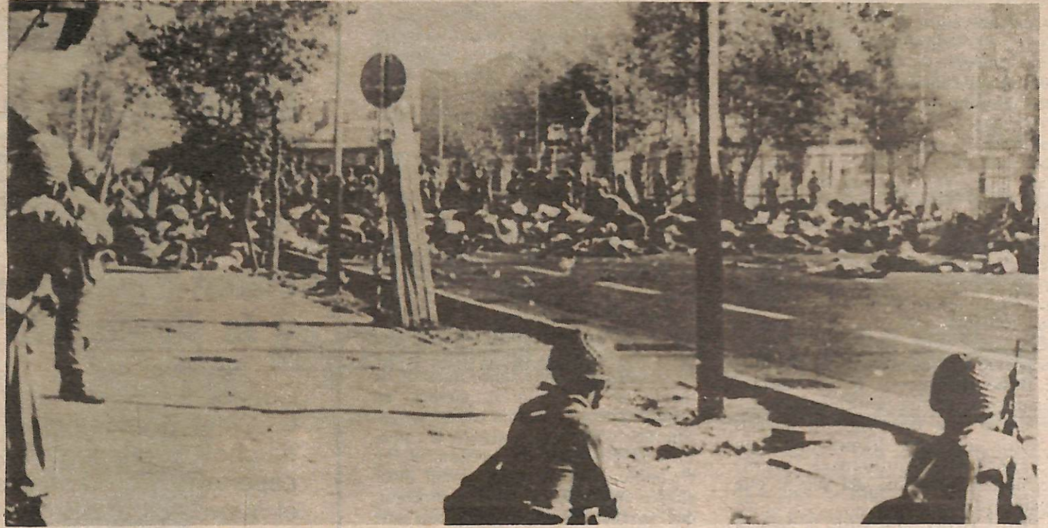
Plaza de los Mártires, Teherán, 8 de septiembre de 1978—Viernes Negro. En este día sólo, las tropas del sha asesinaron a más de 10.000 personas a medida que protestas de masas en contra del sha y el imperialismo EEUU barrían por el país. Esta foto, que muestra a las tropas rodeando a masas de cadáveres, fue escondida por un periódico, y sólo publicada después de ser corrido el sha.

En Irán, más de la mitad del pueblo sigue viviendo en el campo bajo condiciones de siervos, que son aún más miserables que las condiciones en las ciudades. Hace sólo diez años, Irán podía abastecerse de comestibles mediante la producción agrícola autososteniente. Ya para el último año del dominio del sha, Irán necesitaba importar entre el 30% y 40% de sus comestibles, principalmente de EEUU, a un costo de más de $1 mil millones al año. En años anteriores, las corporaciones agrícolas EEUU, ayudadas por rebajas en los impuestos, y otra “ayuda” del régimen del sha, inundaron el país con