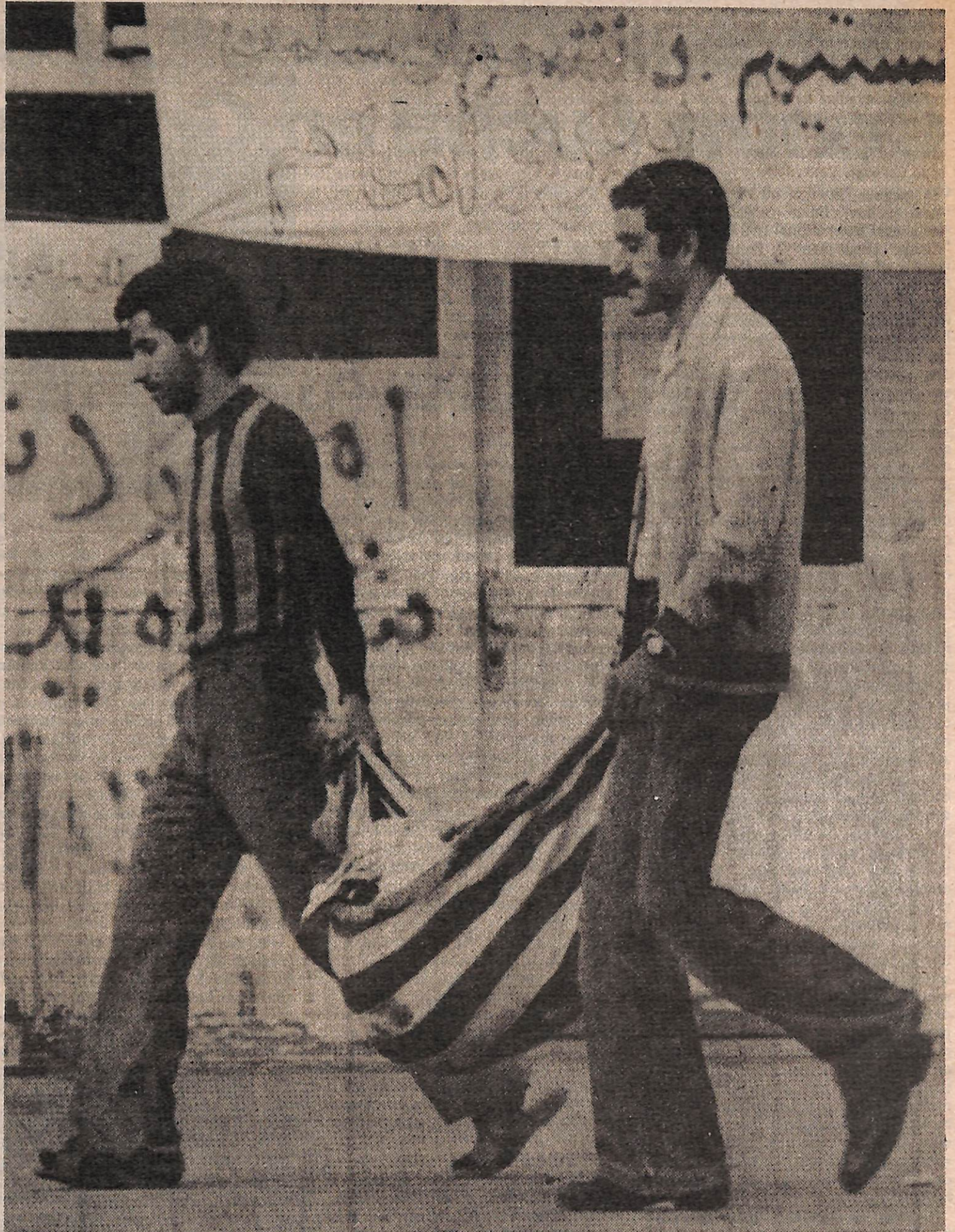
Dos estudiantes en la embajada capturada EEUU en Teherán usan bandera EEUU para cargar basura. Nuestros dominantes se horrorizaron de esto, e intentaron utilizar esta foto para incitar un frenesí chovinista en EEUU. Pero nosotros pensamos que éste es un excelente y apropiado uso para el símbolo del imperialismo EEUU.

Aún cuando Khomeini mantuvo una posición militante, obedeciendo la ira del pueblo iraní, también hubo señas de que no estaba comprometido a verdaderamente dirigir al pueblo en hacer frente a las provocaciones de EEUU. Rehusó verdaderamente desencadenar la furia de los millones de iraníes, temiendo que las fuerzas progresistas y revolucionarias lograran demasiado poder político. Día tras día restringió las protestas políticas a manifestaciones frente a la Embajada de EEUU. También ordenó a las fuerzas armadas de Irán a tomar parte en estas manifestaciones, tanto para tener las manifestaciones bajo control como para demostrarle a EEUU que las fuerzas armadas sí apoyan al gobierno islámico—a pesar de que esto posiblemente pueda salirles como tiro por la culata al radicalizar aún más a las tropas.