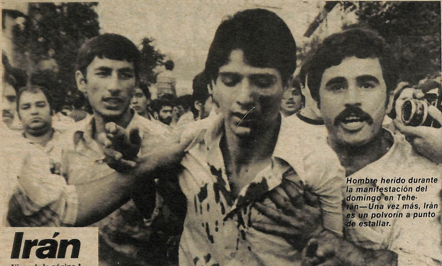
Hombre herido durante la manifestación del domingo en Teherán—Una vez más, Irán es un polvorín a punto de estallar.