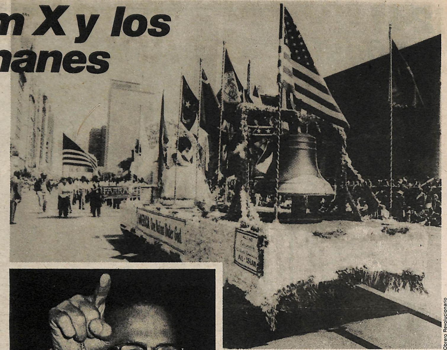
Arriba: Carroza en el "Día del Patriotismo del Nuevo Mundo", auspiciado por la Comunidad Mundial de Al-Islam. El letrero en el lado de la carroza dice: "América—Una Nación Bajo Dios".

El resurgimiento del nacionalismo negro en los 1950 reflejaba la agudización de la contradicción na-