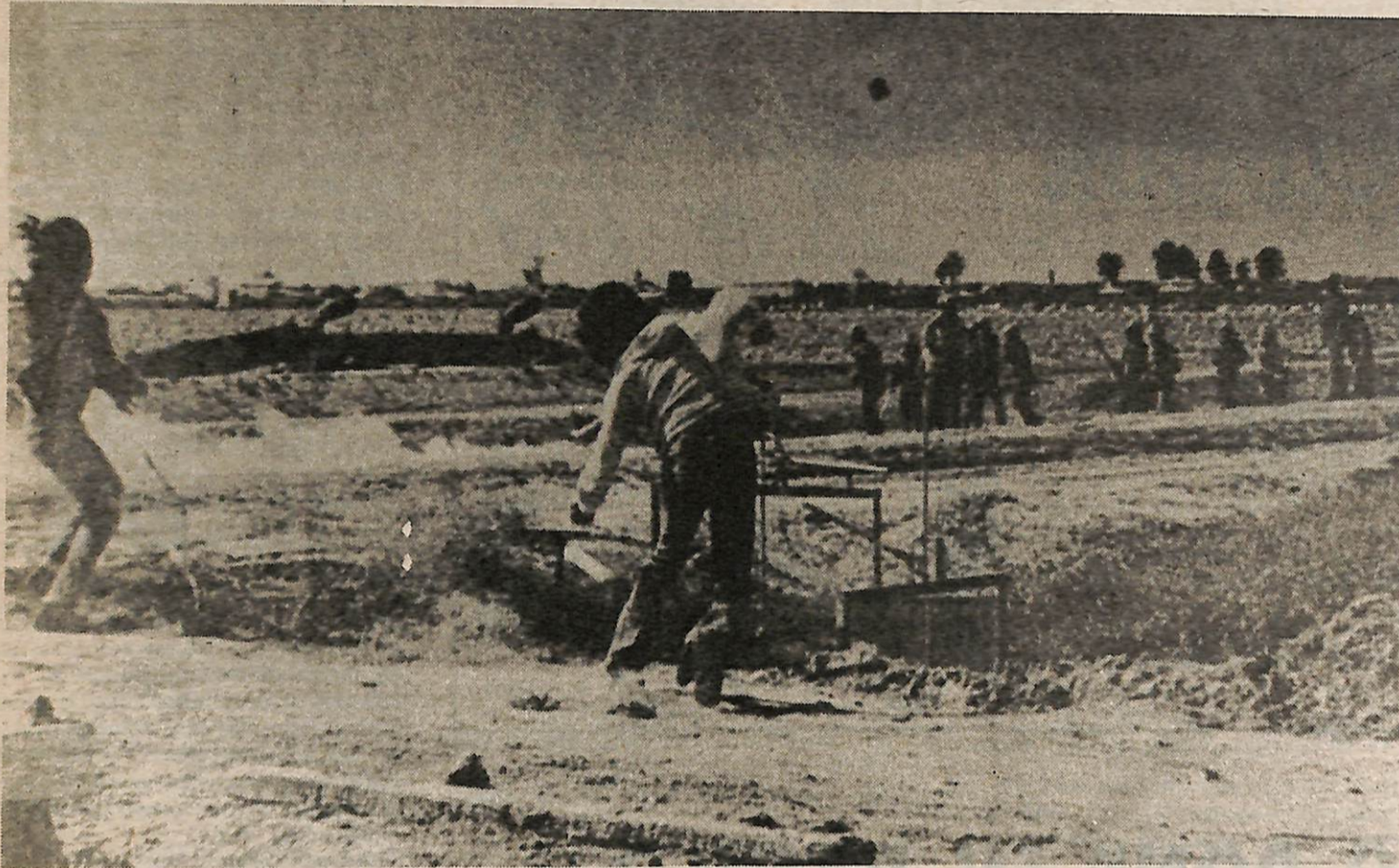
HASTA LOS "HUELGUISTAS" MAS JOVENES ENFRENTAN LOS PUERCOS CON VALOR--ESTOS PUERCOS QUE PROTEGEN EL SISTEMA QUE MANDA ESQUIROLES Y ASESINOS A LOS FILES.

A como la huelga de los campesinos ha durado 14 semanas y sigue creciendo fuerte, la clase gobernante tenía poca preferencia en su "perdón" de los asesinos de Contreras. Ellos están desesperados por desbaratar esta huelga y desesperados por calmar el coraje y odio creciente entre los campesinos contra todo el sistema capitalista. Pero cada movimiento que los capitalistas hagan es una acusación más de sus sistema criminal. Ellos no pueden esconder su naturaleza de clase--para gobernar con violencia contra la clase trabajadora, para matar libremente a los Rufinos Contreras, y dejar que esquirolles asesinos salgan libres.