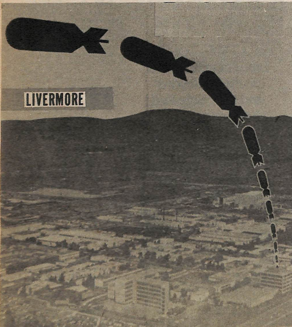
EL LIVERMORE LAB: UNA FABRICA DE HORRORES BAJO EL OLOR CIENTIFICO Y ACADEMICO. COME $600 MILLONES AL AÑO DE NUESTROS IMPUESTOS PARA PRODUCIR BOMBAS PARA LOS CAPITALISTAS. (foto del volante de las fuerzas anti-nucleares)