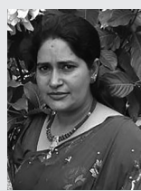
□ इतिहास सुवासरी □

परिवारवाद नातावाद गुटवाद पदलोलुपवाद व्यक्तिवाद अवसरवाद लम्पसारवाद र फुटवाद यिनका अहंकार घमण्ड