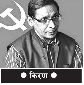
● किरण ●

पुरानो राज्यसत्ता र व्यवस्थाअन्तर्गत नियमित रूपमा हुने निर्वाचनहरूमा प्रायशः जनताले कहिले नेपाली कांग्रेस, कहिले संशोधनवादी कम्युनिस्ट, कहिले कुनै अवसरवादी वा भ्रष्ट तत्वहरूलाई भोट हाल्ने र जिताउने काम गर्दै आएका छन्। यो चक्र पुरानै र नयाँ ढङ्गले पनि निरन्तर दोहोरिने गरेको छ। जसले जिते पनि मूलतः उस्तै, जनताका लागि उपलब्धि भने हात लाग्यो शून्य। न भोट दिन्न भन्ने अर्थात् 'नो भोट'को व्यवस्था छ, न त जिताइएको उमेदवारले गलत काम गरे उसलाई प्रत्याह्वान गर्न पाउने अधिकार छ। अनि नत मन परेको मान्छेहरूलाई जिताउन सक्ने अवस्था र परिस्थिति नै छ। चुनाव जित्न फर्जी मत हाल्ने र त्यसले पनि नपुगे मतपत्र च्यातेर भए पनि चुनाव जित्ने गरेको हामीले देखेका छौं। यसरी बारम्बार दोहोरिइ रहने यो चुनावी चक्र र चक्रव्यूहमा क्रमभङ्ग कहिले र कसरी हुने हो? यो वर्तमान नेपाली राजनीतिको एक सर्वाधिक महत्वको गम्भीर प्रश्न हो