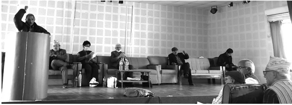
गरेको प्रेस वक्तव्यमा बैशाख ३० गते सशक्त रूपमा बहिष्कार गर्ने निर्णय हुने भनिएको स्थानीय तहको निर्वाचन ९ वटा बुँदामा जारी वक्तव्यको ७ नं बुँदामा स्थानीय तहको निर्वाचन

काठमाडौं। नेपाल कम्युनिस्ट पार्टी (क्रान्तिकारी माओवादी)को गएको आइतबार सम्पन्न केन्द्रीय समितिको बैठकले संसदीय व्यवस्था अन्तर्गतको आसन्न स्थानीय निर्वाचन सशक्त रूपमा बहिष्कार गर्ने निर्णय गरेको छ। बैठकले विचार, राजनीति, संगठन र संघर्षका विषयमा गरेका ऐतिहासिक महत्वका निर्णयहरू पार्टीका महासचिव मोहन वैद्य 'किरण'ले एक प्रेस वक्तव्यमार्फत् सार्वजनिक गरिसक्नुभएको छ। पार्टीका महासचिव किरणले जारी