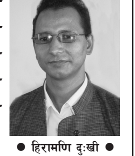
● हिरामणि दुःखी ●

अमेरिकाको रक्षा मन्त्रालयले आफ्नो देशका लागि आगामी हजार बर्षका चुनौतीहरू के छन् त भन्ने विषयमा अनुसन्धान गर्ने यो 'मिलिनियम च्यालेञ्ज कर्पोरेसन' नाम दिएर एउटा परियोजना तयार पार्यो । त्यस परियोजनाअन्तर्गत उसले अबका चुनौती एशिया महादेशबाट हुने तथ्य प्रक्षेपण गर्‍यो । त्यो पनि उदाउँदै गरेको नयाँ विश्व महाशक्ति बन्न खोजेको चीन र त्यसपछिको दोस्रो राष्ट्र भारतलाई निश्चित गर्‍यो