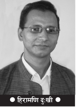
● हिरामणि दुःखी ●

‘नयाँ जनवादी राज्यसत्ता स्थापना गर्न जनयुद्धको बाटोमा अघि बढौँ’