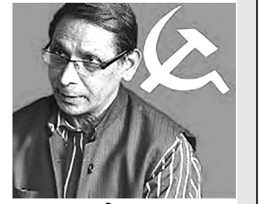
● किरण ●

जनजाति समुदाय भनेको कबिलाभन्दा माथिको र जातिभन्दा तलको समुदाय हो । जनजाति समुदाय वंशगत रक्तसम्बन्धमा कम र भूगोल, भाषा एवम् संस्कृतिमा बढी आधारित हुन्छ । जाति मानिसहरूको ऐक्यताको विकसित रूप हो । जातिलाई अर्को शब्दमा राष्ट्र पनि भनिन्छ