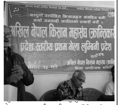
नेपाल क्रान्तिकारी बाँकी ७ पेजमा