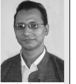
● हिरामिणी दुःखी ●

यो एमसीसी परियोजना पचास करोड अमेरिकी डलरको विकास परि योजना हो । जसमा तेह्र करोड डलर नेपाल सरकारले ब्यहोर्ने प्रस्ताव छ भने बाँकी सैंतीस करोड डलर अमेरिकी सरकारले अनुदानमा दिने हो । अमेरिकी सरकारले नेपालमा यस अघि पनि आर्थिक सहयोग अनुदान तथा ऋण उपलब्ध गराउँदै आएको छ