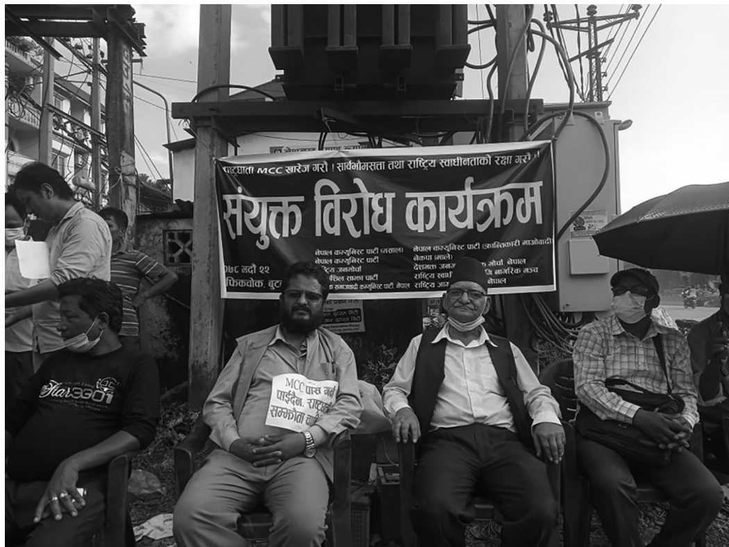
एमसीसी खारेज अभियान अन्तर्गत चितवन जिल्लामा गरिएका कार्यक्रमहरूको भ्रमणहरू

चितवन। चितवनमा राष्ट्रघाती एमसीसी सम्झौताको खारेजीको माग गर्दै विभिन्न ठाउँमा विरोध कार्यक्रम, कोणसभाहरू, सिडियो कार्यालय घेराउ, मन्त्रीका नामका संस्थाहरू तथा