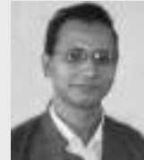
● हिरामणि दुःखी ● सञ्जीत- काजी गाउँले

इतिहास बोल्छ सधैं लड्यौं नालापानी, किन दुख्छ सधैं मलाई मेरे कालापानी।