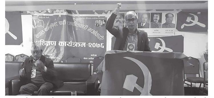
बर्दिया । नेकपा (क्रान्तिकारी माओवादी) पश्चिम ब्यूरोको प्रशिक्षण कार्यक्रम सम्पन्न भएको छ । बर्दियाको भुँरीगाउँमा बुधवारबाट बाँकी ८ पेजमा

क्रान्तिकारी माओवादी पश्चिम ब्यूरोको प्रशिक्षण कार्यक्रम सम्पन्न