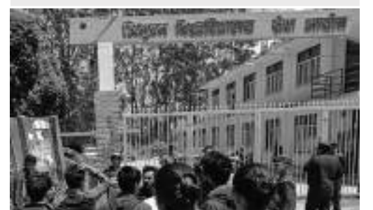
त्रिवि सेवा आयोग अध्यक्षलगायतले आफ्ना परिवार, नातेदार र राजनीतिक भागबण्डाका आधारमा ... बाँकी ४ पेजमा

अखिलतयारले परीक्षा नतिजासँग सम्बन्धित कागजातहरू नियन्त्रणमा लिएपछि त्रिविका सेवा समितिमा रहेका अध्यक्षदेखि सदस्यहरू सबै सिंहदरवार र बालुवाटार धाउन थालेका बताइएको छ । नातावाद, कृपावाद र राजनीतिक भागबण्डा तिने नेता तथा ... बाँकी ८ पेजमा