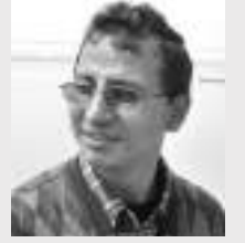
● हिरामणि दुःखी