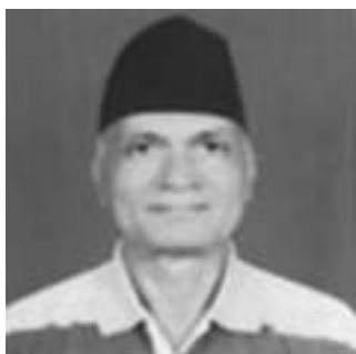
● रविकिरण 'निर्जीव'

तिम्रा क्वार्टर, कार्यालय र पिँढीहरूमा ढुकेर बस्न अभ्यस्त हुँदै आएका छौं।